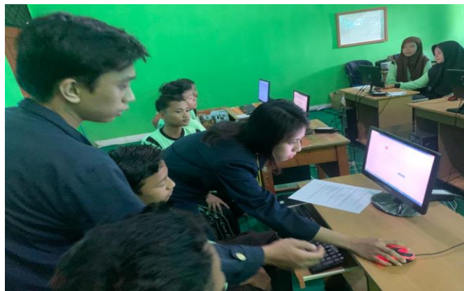
Pelatihan tentang Desain Grafis di SMP Piri Margo Dadi