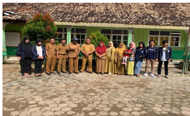
Foto Bersama Kepala Sekolah beserta Guru SMP PIRI