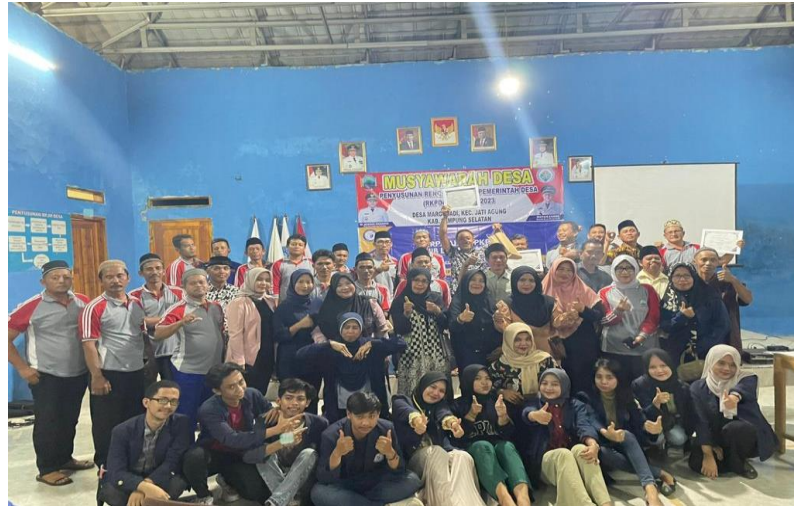
Foto Bersama Pengurus Balai Desa Margo Dadi