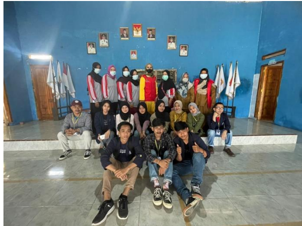
Stunting Posyandu di Balai Desa