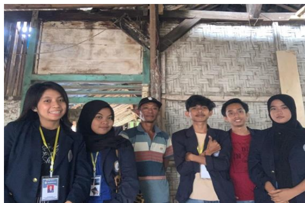
Kunjungan ke UMKM Palet Kayu