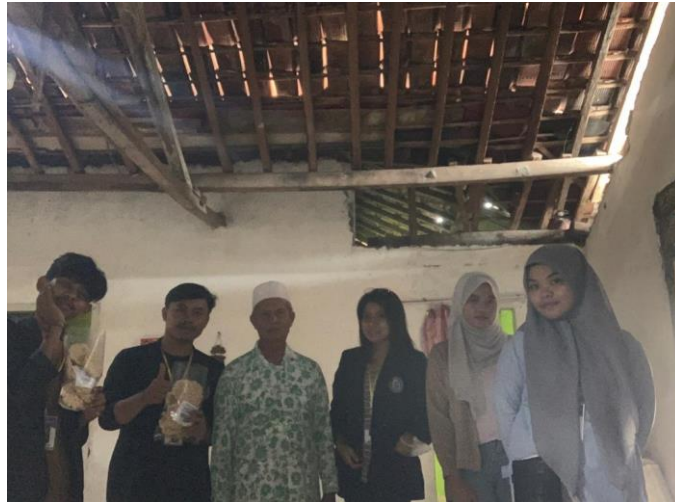
Berkunjung ke UMKM Rengginang