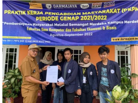
Penerimaan Peserta PKPM di Desa Margo Dadi