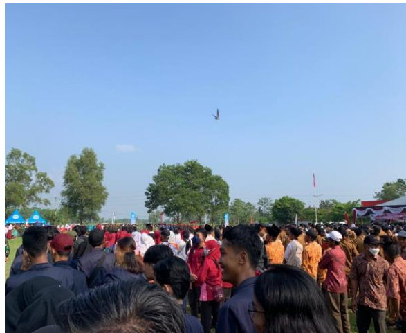
Upacara HUT RI di kecamatan Jati Agung