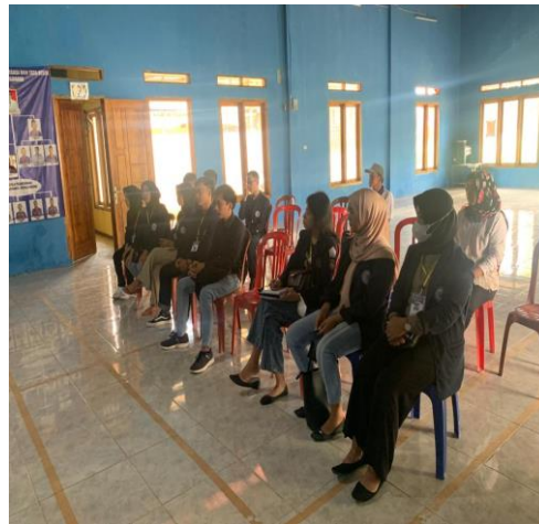
Rapat Pembentukan Panitia 17 Agustus