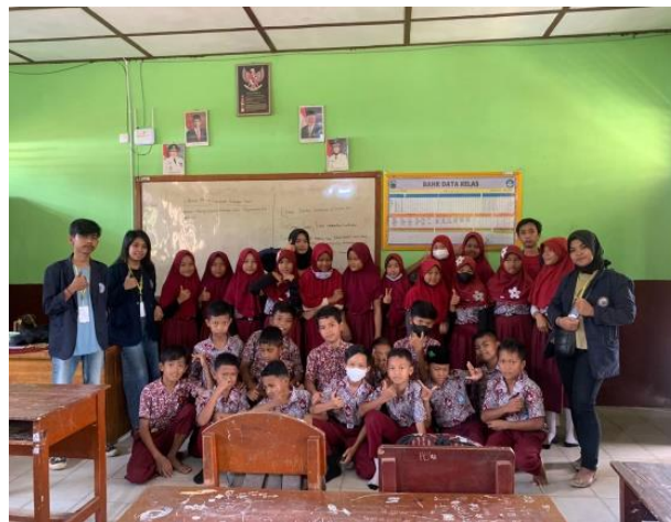
Sosialisasi ke SDN 3 Margo Dadi