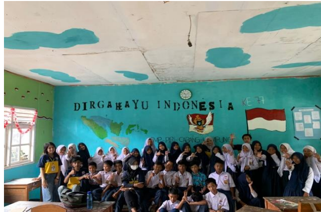
Sosialisasi Pencegahan Bullying di SMP Piri Margo Dadi