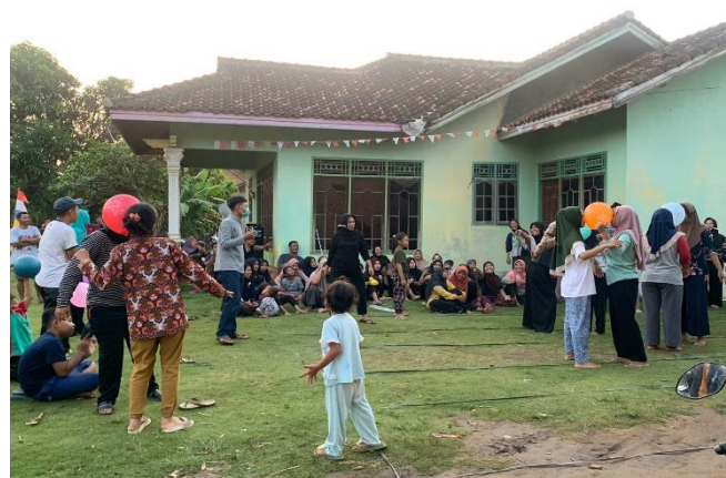
Perlombaan Kemerdekaan di Dusun 1