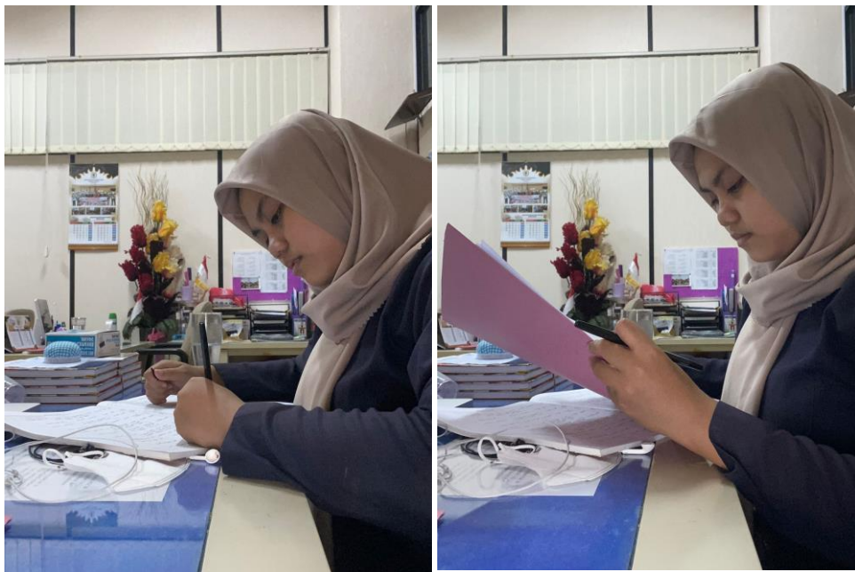
Gambar 2. Melakukan Pencatatan surat masuk & Keluar