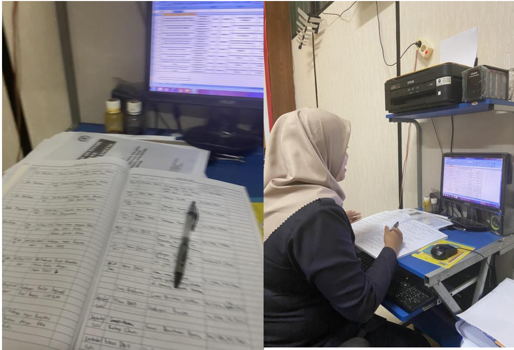
Gambar 3. Menulis dan Mencatat Nomor Surat dengan menggunakan Excel