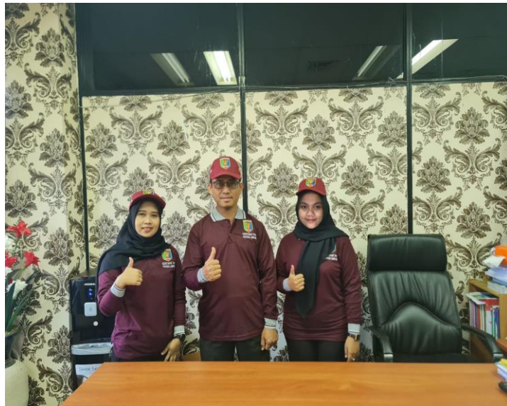
Gambar 4. Kegiatan Persiapan Rapt Kerja SiSumur Elok