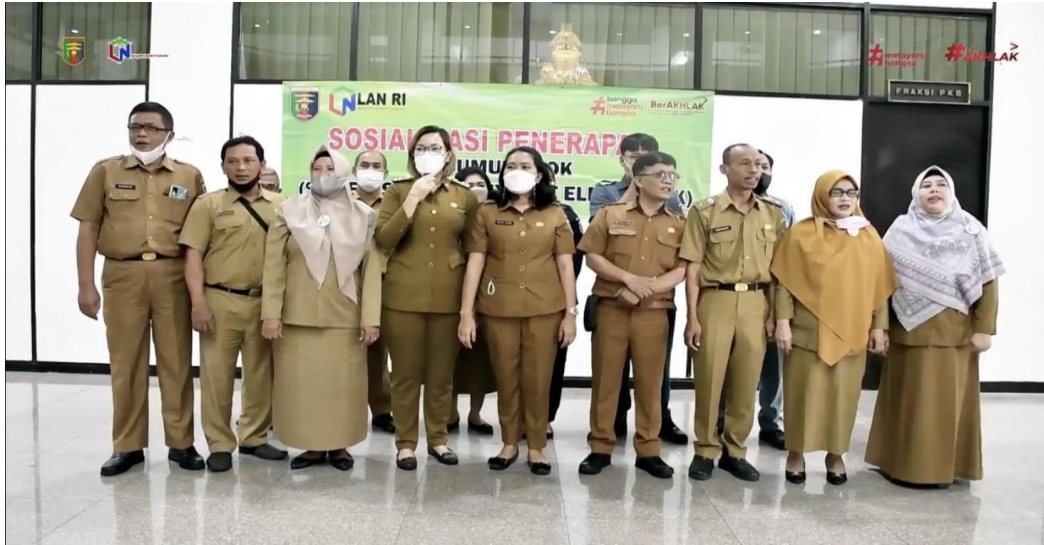
Gambar 5. Melaksanakan Sosialisasi Penerapan Program Si sumur elok