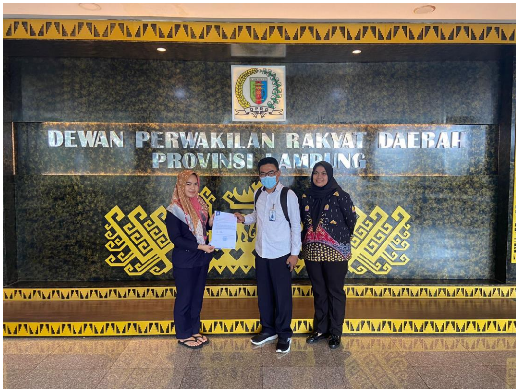
Gambar 1. Penghantaran Mahasiswa Kerja Praktek (KP) oleh Dosen Pembimbing Lapangan (DPL) ke Kantor Sekretariat DPRD Provinsi Lampung