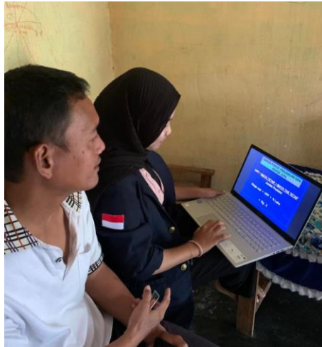
Gambar 2.1 Penerapan Strategi Mengelola Laporan Keuangan

Dari laporan keuangan di atas dapat disimpulkan bahwa jumlah kas sebesar Rp 550.000, modal Rp 450.000, dan biaya-biaya yang dianggarkan sebesar Rp 450.000, sedangkan pendapatan yang dihasilkan sebesar Rp 550.000 untuk 1 bulan penuh. Maka jumlah laporan keuangan sebesar Rp 1.000.000 untuk di debit dan di kredit.