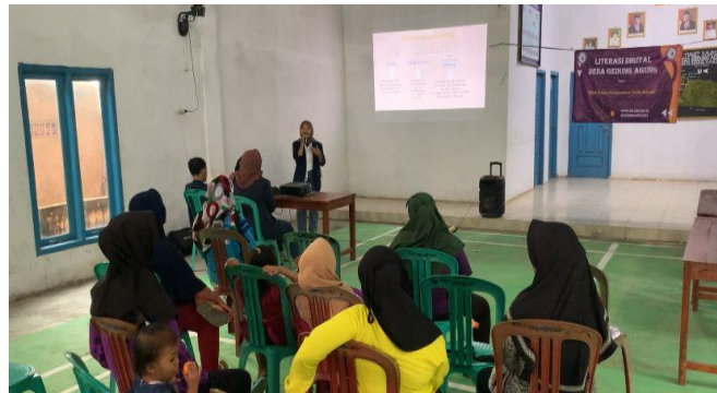
Gambar 2.3 Pelatihan Mengenai Pentingnya Literasi Digital

ataupun lingkungan masyarakat. Kecakapan pengguna dalam literasi digital mencakup kemampuan untuk menemukan, mengerjakan, mengevaluasi, menggunakan, membuat serta memanfaatkannya dengan bijak, cerdas, cermat serta tepat sesuai kegunaannya.