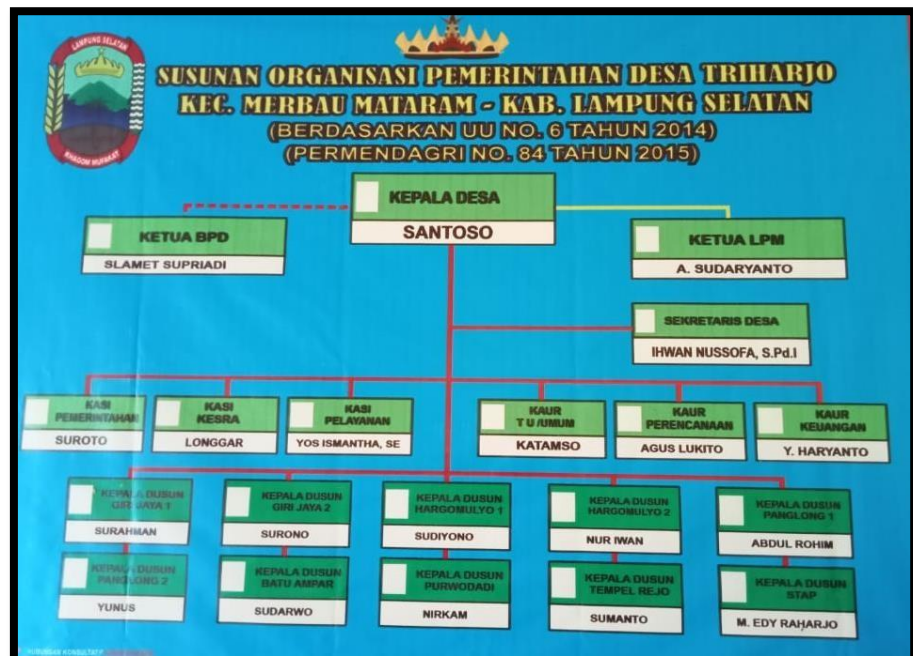
Gambar 1.2 Struktur Organisasi Pemerintahan Desa Triharjo

Nama-nama dusun yang menjadi bagian Desa Triharjo diantaranya yaitu, Hargomulyo I, Hargomulyo II, Girijoyo I, Girijoyo II, Tempel Rejo, Panglong I, Panglong II, Batu Ampar, Purwodadi, dan Staf.