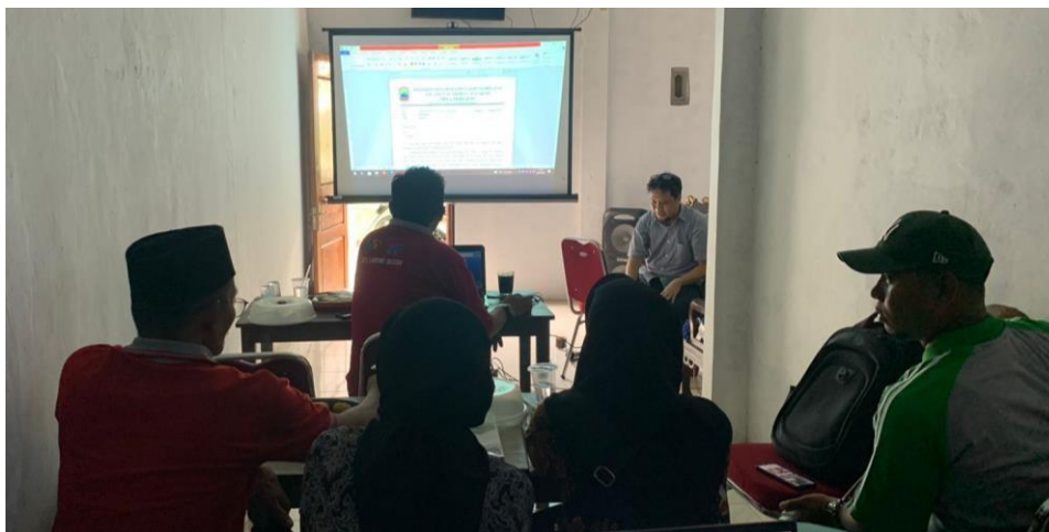
Gambar 2.13 Pelatihan Microsoft Word dan Excel hari kedua