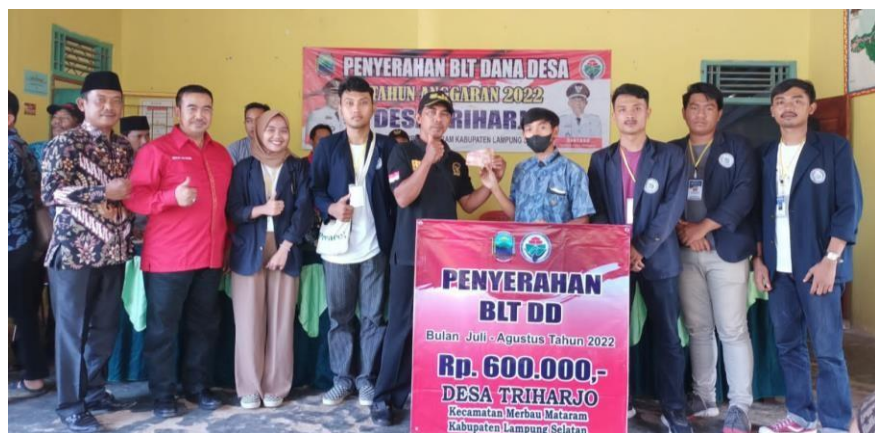
Gambar 2.4 Kegiatan penyerahan bantuan dana BLT ke pihak masyarakat Desa Triharjo