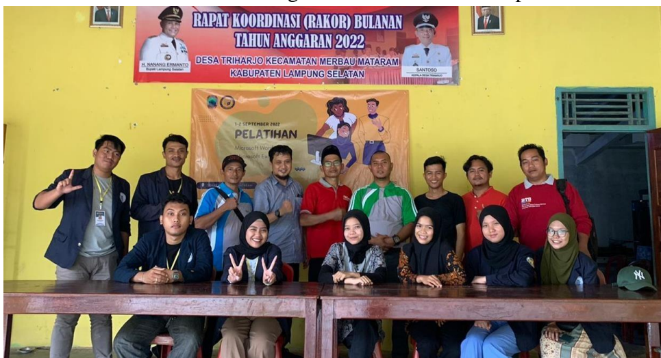
Gambar 2.15 Foto bersama dengan Dosen Pembimbing dan Aparatur