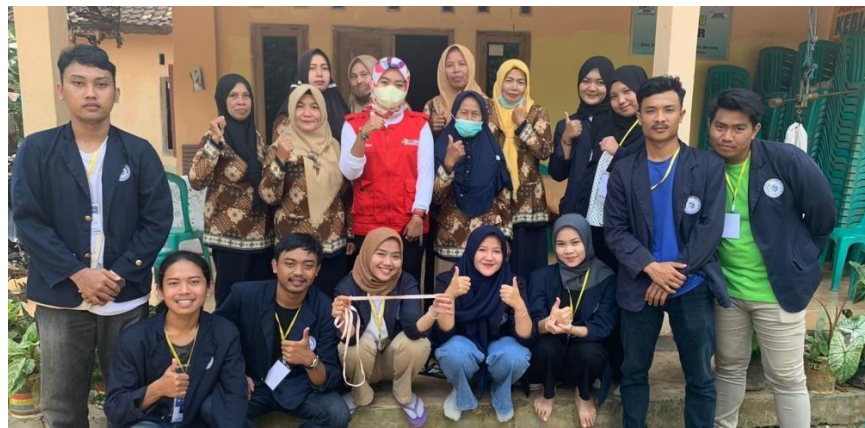
Gambar 2.3 Kegiatan posyandu di Dusun Panglong II