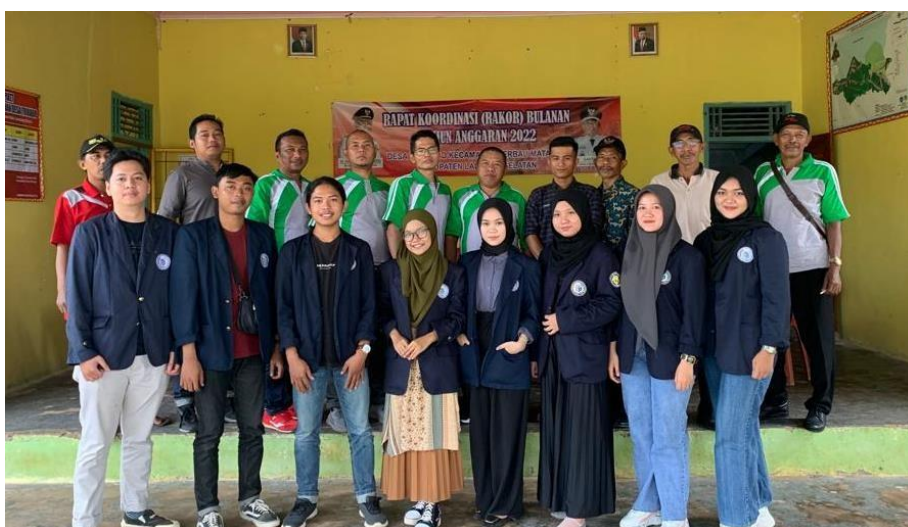
Gambar 2.1 Persetujuan kerja sama dengan Pihak Desa Triharjo