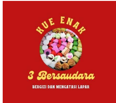
Gambar 2.7 Logo UMKM Kue Pasar 3 Bersaudara