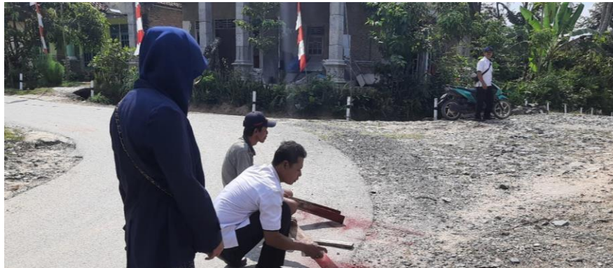
Gambar 2.2 Pengukuran jalan yang ada di Desa Triharjo