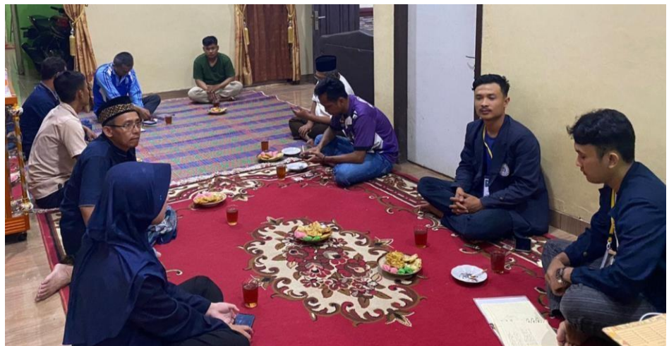
Gambar 2.5 Rapat kegiatan HUT RI ke 77 bersama panitia di Dusun Girijaya II Desa Triharjo