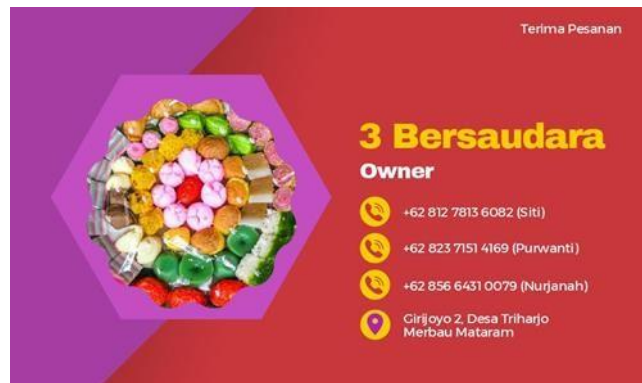
Gambar 2.8 Design Kartu Nama UMKM Kue Pasar 3 Bersaudara