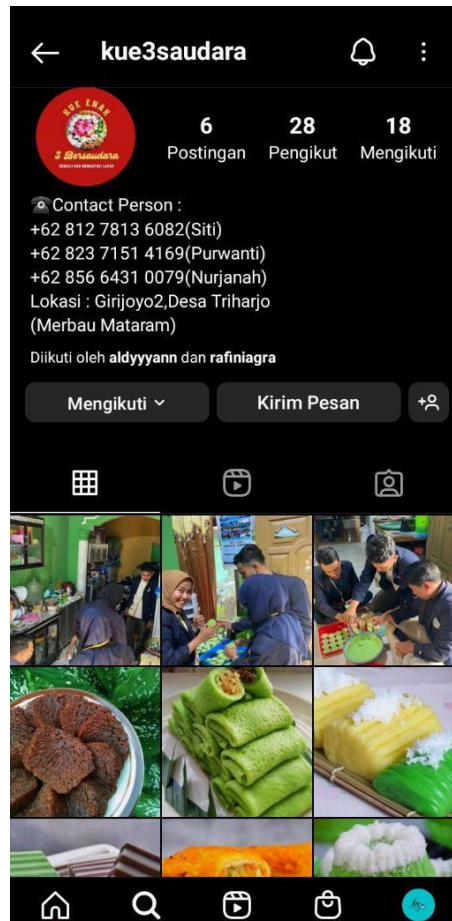
Gambar 2.9 Instagram UMKM Kue Pasar 3 Bersaudara

promosi online untuk kue pasar 3 Bersaudara, tak hanya itu titik lokasi pun kami buat untuk memudahkan konsumen dalam menemukan lokasi kue pasar 3 bersaudara. Logo dan Kartu Nama, juga menjadi ide terbaik yang kami berikan. Logo kami buat untuk menjadi identitas UMKM agar brand image konsumen melekat dan selalu bisa mengenal produk kue dari UMKM 3 Bersaudara, sedangkan kartu nama menjadi alternatif promosi non digital yang memudahkan konsumen menghubungi dan memesan produk dari UMKM Kue Pasar 3 Bersaudara ini.