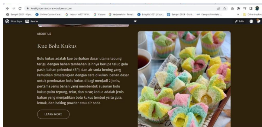
Gambar 2.10 Tampilan Website Kue Pasar 3 Bersaudara