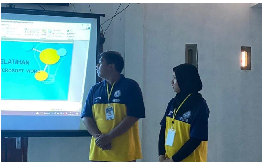
Gambar 2.12 Pelatihan Microsoft Word dan Excel hari pertama