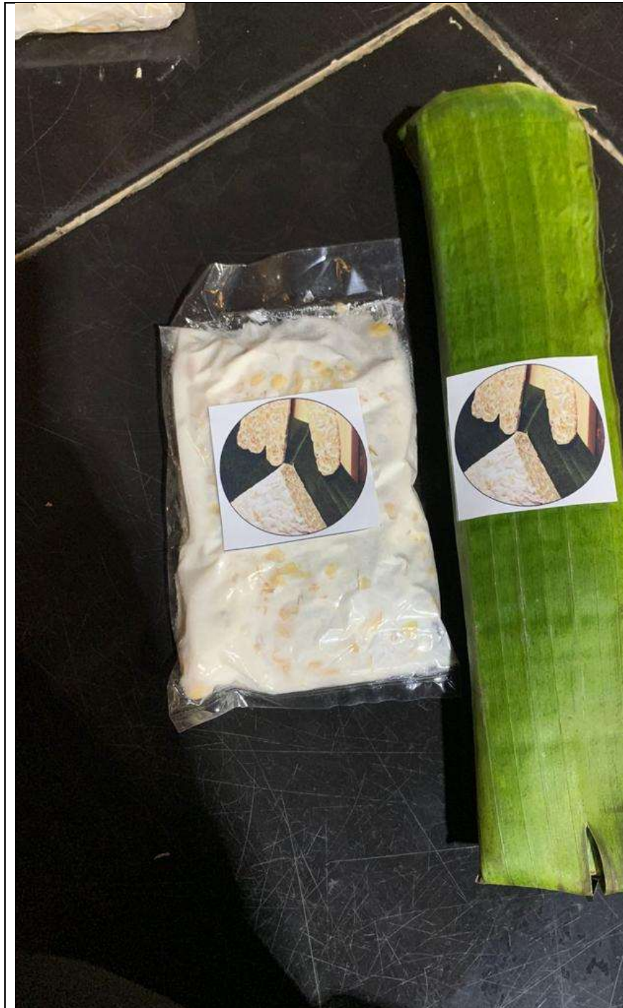
Gambar 2.4 Proses Pembuatan Tempe