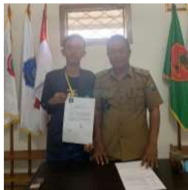
Gambar 2.2 Permohonan Surat Izin Kegiatan

Permohonan Surat Izin kepada Kepala Desa Batu Agung untuk dapat melaksanakan kegiatan PKPM.