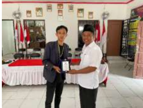
Gambar 2.7 Pemberian Plakat

Pemberian plakat bertujuan sebagai ucapan terimakasih karena telah diberikan izin untuk melakukan kegiatan PKPM di Dusun Batu Agung, Desa Batu Agung Kecamatan Merbau Mataram.