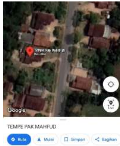
Gambar 2.1 Lokasi UMKM Tempe Pak Mahfud

Survey kegiatan PKPM bertujuan untuk mengetahui lokasi kegiatan PKPM yaitu di UMKM Tempe Pak Mahfud yang berlokasi di Dusun 1, Dusun Batu Agung, Desa Batu Agung.