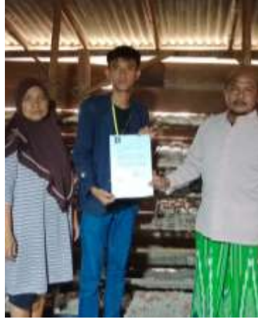
Gambar 2.3 Permohonan Surat Izin Kegiatan kepada UMKM Tempe

Permohonan Surat Izin kepada Pemilik UMKM Tempe untuk dapat melaksanakan kegiatan PKPM.