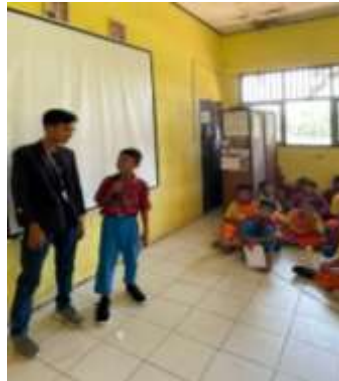
Gambar 2.5 Pendampingan Belajar Siswa

Memberikan pemahaman materi kepada murid sekolah dasar, tentang bahaya pergaulan bebas atau bully.