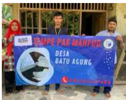
Gambar 2.6 Pembuatan Banner

Pembuatan banner untuk UMKM diharapkan dapat membantu penjual dalam mengenalkan produknya, dan membuat pembeli lebih mudah dalam mencari lokasi UMKM Tempe.