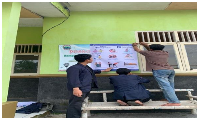
20. Pemasangan Banner Stunting dan PHBS