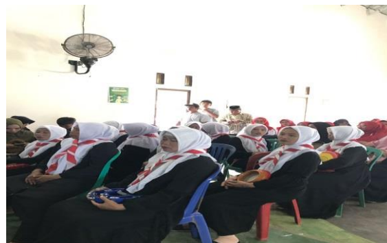
Perlombaan 17 Agustus Purwotani