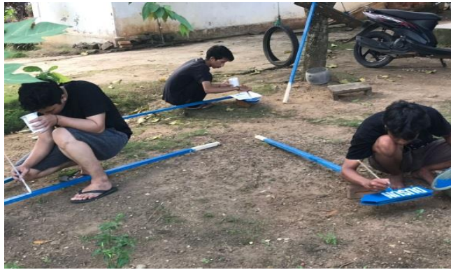
19. Pembuatan Plang