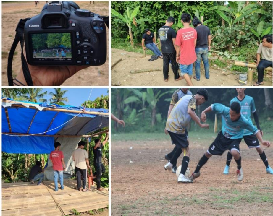
Gambar 2.12 Panitia Liga Desa

Kegiatan liga Desa di laksanakan di setiap hari sabtu dan minggu. Pada kegiatan ini mahasiswa di minta untuk berpartisipasi sebagai panitia yang sedang melaksanakan kegiatan kompetisi bola yang ada di desa Baru Ranji.