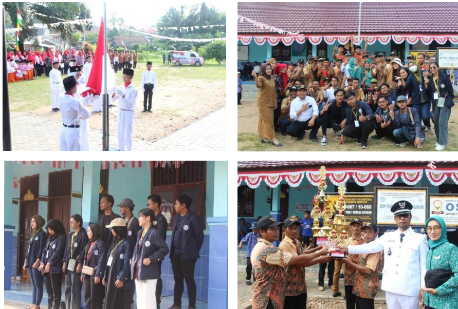
Gambar 2.3 Upacara 17 Agustus bersama Penduduk Desa

Kami berpartisipasi dan ikut andil dalam kegiatan 17 Agustus di Desa Bar Ranji yang berlangsung selama ? hari. Kegiatan yang kami ikuti mulai dari mencari bahan perlombaan, menyiapkan kegiatan perlombaan, melakukan penilaian perlombaan, mencari hadiah unuk perlombaan, dan mengikuti puncak acara kegiatan.