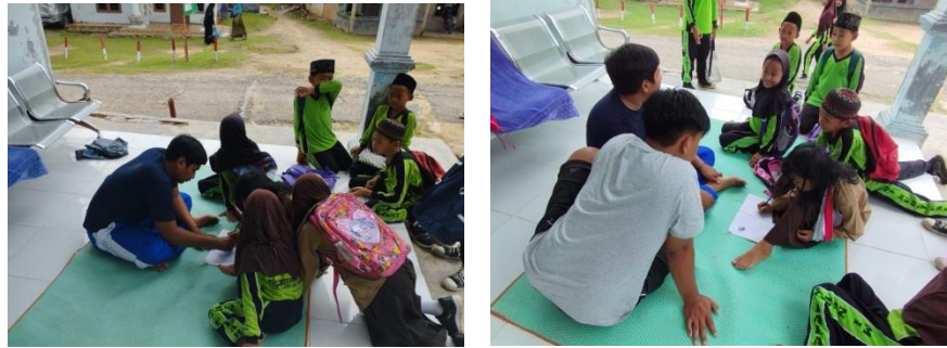
Gambar 2.10 Kegiatan Belajar Bersama di Posko

Di sekitar tempat tinggal kami banyak sekali anak-anak yang membutuhkan pembelajaran tambahan, maka dari itu kami mahasiswa PKPKM darmajaya mengadakan les yang di laksanakan pada tanggal 19, 26 Agustus, dan 2 September. Kegiatan ini berlangsung saat merek pulang dari sekolah nya.