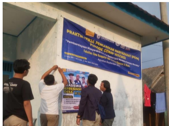
Gambar 2.14 Proses Pemasangan Banner