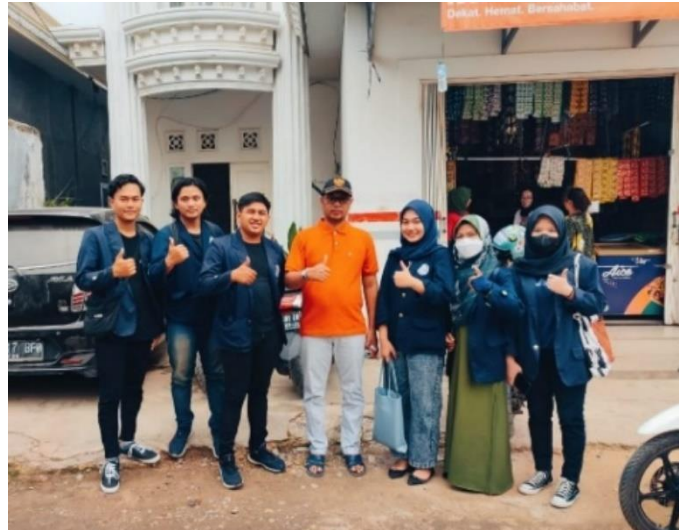
Gambar 2.13 Melakukan Kegiatan Survei Desa Baru Ranji

Berikut gambar dokumentasi yang diambil selama melakukan Praktek Kerja Pengabdian Masyarakat :