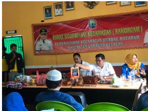
Gambar 2.16 Pelepasan di kecamatan