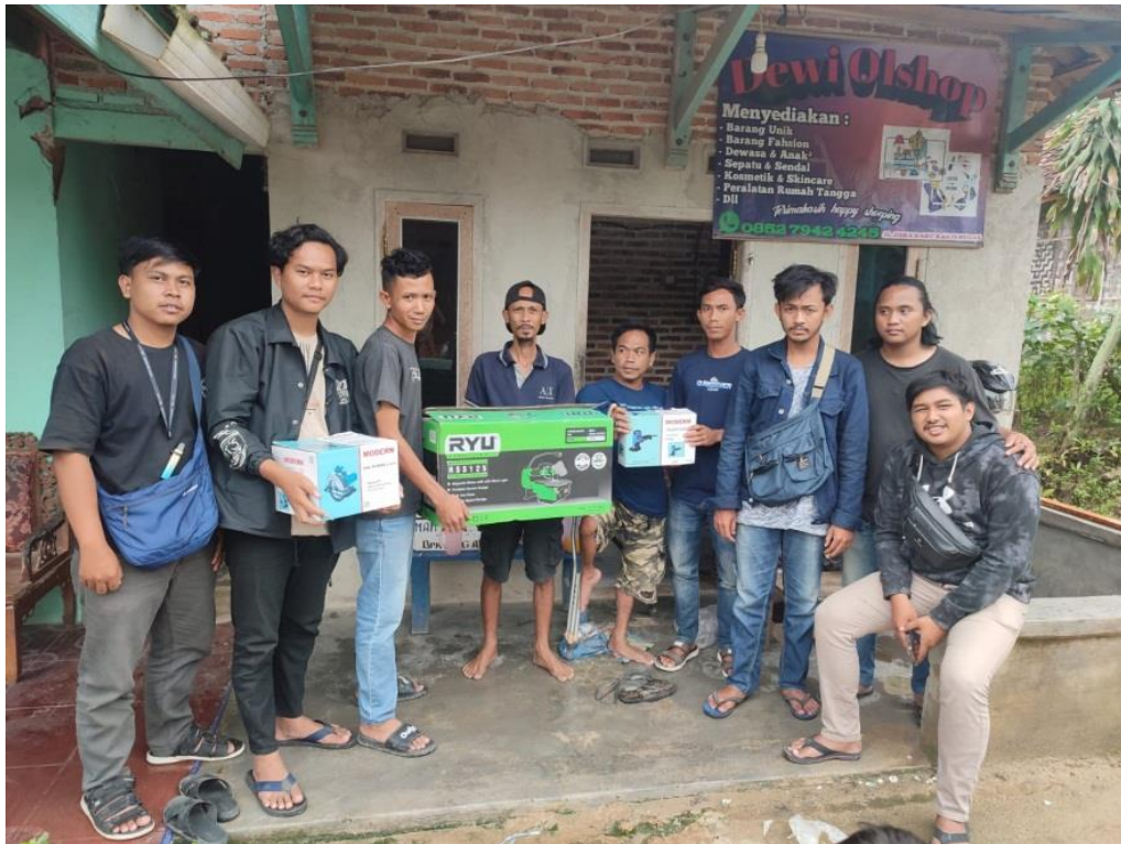
Gambar 2.9 Penyerahan Alat Bersama UMKM

Kegiatan survey sekaligus pembelian alat produksi UMKM Pengrajin Kayu ini dilakukan pada Hari Kamis, 29 Agustus 2022. Pembelian alat ini dilakukan bersama dengan rekan sejawat dan pihak BUMDES. Pembelian alat produksi ini berlokasi di Bandar Lampung tepatnya di daerah Tanjung Karang. Kemudian di hari itu juga dilakukan penyerahan alat produksi kepada pihak UMKM Pengrajin Kayu.