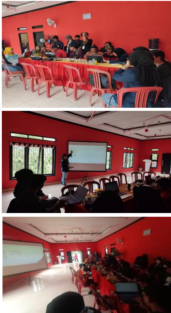
Gambar 2.8 Pelatihan IT Bersama Aparatur Balai Desa

Pelatihan IT bersama Aparatur Balai Desa yang dilakukan pada Hari Selasa, 27 Agustus 2022. Adapun teknis pelaksanaan kegiatan ini dilakukan di Kantor Balai Desa yang meliputi penyampaian informasi terkait penggunaan Microsoft Word dalam penulisan yang tepat, dan penggunaan shortcut serta penggunaan pada Microsoft Excel dalam masalah perhitungan dan rumus-rumus dasar dalam Excel. Pelatihan ini kami lakukan dengan memberikan informasi melalui PPT dan praktek secara langsung dengan laptop setiap Staf-staf Balai Desa. Kami berharap dengan adanya pelatihan dan sharing session ini kedepannya dapat membantu proses pekerjaan bagi staf-staf Balai Desa dapat lebih efektif dan efisien.