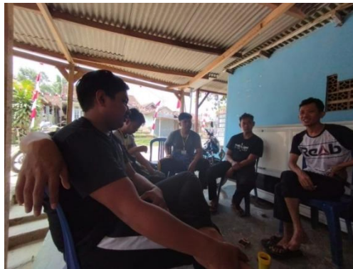
Gambar 2.4 Melakukan konfirmasi ke pihak BUMDES

Konfirmasi rancangan solusi permasalahan UMKM ini dilakukan pada Hari Sabtu, 13 Agustus 2022. Saya dan pihak BUMDES melakukan kegiatan diskusi bersama yang dilaksanakan di Kantor BUMDES dengan rekan mahasiswa PKPM yang lain. Konfirmasi rancangan solusi ini diterima oleh pihak BUMDES Desa Baru Ranji dan pihak BUMDES meminta kami untuk tetap melanjutkan rancangan solusi ini yang nantinya akan kami sosialisasikan kepada pihak UMKM yang ada di Desa Baru Ranji.