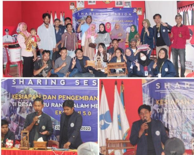
Gambar 2.7 Shering Sesion Bersama UMKM

Kegiatan sharring session ini dilakukan pada hari Kamis, 25 Agustus 2022. Adapun teknis pelaksanaan kegiatan ini meliputi penyampaian informasi terkait digital marketing, administrasi dan branding. Informasi tambahan yang telah disepakati antara kami dan BUMDES yaitu dalam proses pelaksanaan pemasaran produk UMKM, seluruh UMKM yang ada di Desa Baru Ranji bisa melakukan konfirmasi produknya kepada pihak BUMDES yang nantinya BUMDES membantu melakukan proses pemasaran produk dari UMKM. Dan dihari itu juga BUMDES dan UMKM Pengrajin Kayu melakukan kesepakatan dalam pengadaan alat produksi.