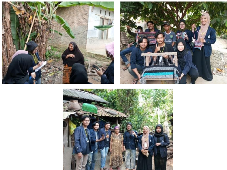
Gambar 2. 1 Kunjungan UMKM

Kegiatan kunjungan ke UMKM Desa Baru Ranji dilakukan pada Hari Rabu, 10 Agustus 2022. Tujuan dari kegiatan ini adalah untuk mengetahui beberapa informasi yang kami butuhkan sebagai bahan penelitian dan bahan pengembangan UMKM kedepannya seperti informasi terkait data UMKM selama berdiri dan menjalani suatu usaha, teknis pelaksanaan kegiatan UMKM, metode yang di gunakan selama proses produksi UMKM, sampai informasi mengenai anggaran rincian pendanaan. Selain itu, berdiskusi dengan pemilik usaha apa saja hambatan yang di alami selama menjalankan usaha. Dari hasil diskusi ini di dapatkan hasil berupa inovasi pembuatan pasar digital untuk memberikan pasar yang luas dan serta kami juga telah mengupayakan pengajuan alat kepada pihak desa untuk memudahkan produksi di UMKM tersebut.