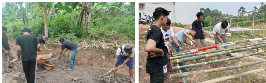
Gambar 2.11 Gotong Royong

Gotong royong yang diadakan desa baru ranji pada tanggal 14, 21, 28 Agustus 2022 bersama masyarakat desa baru ranji untuk membantu membersihkan area dusun baru ranji. Dengan adanya kegiatan ini dapat menimbulkan rasa saling tolong menolong dan kebersamaan masyarakat desa baru ranji.