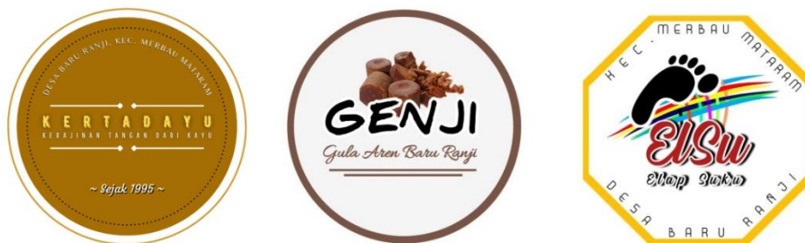
Gambar 2.5 Hasil Pembuatan Logo UMKM

Proses pembuatan logo tanggal 15 Agustus 2022 dilakukan dengan menggunakan aplikasi Pixellab dan Canva. Logo yang dibuat memiliki unsur atau arti tersendiri yang melambangkan produk dari UMKM tersebut mulai dari pengerajin kayu, pengerajin kayu, dan juga gula aren. Logo tersebut terdapat nama dari UMKM tersebut.