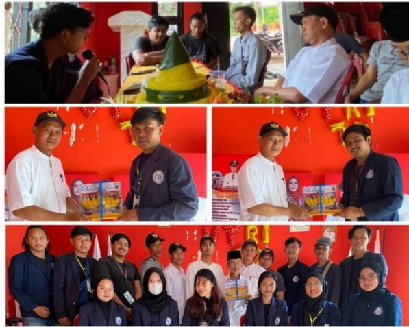
Gambar 2.15 Perpisahan dengan Aparat Desa