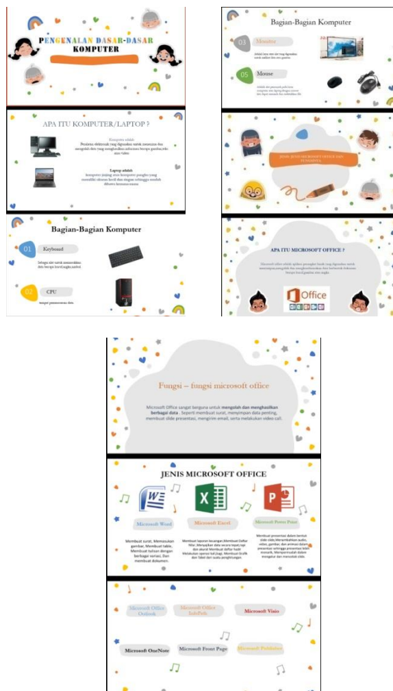
Gambar 2.3 Tampilan Power Point Pengenalan Dasar-Dasar Komputer dan Microsoft Office

Pemberian Edukasi ini bertujuan untuk memberikan pengetahuan dan pengenalan Dasar-Dasar Komputer seperti apa itu komputer/laptop, keyboard, mouse, CPU, Monitor dan pengenalan semua jenis microsoft office dan cara menggunakan Microsoft Word kepada anak-anak yang ada di SDN 3 Jati Baru agar bertambahnya wawasan anak-anak sehingga kepercayaan diri dari anak-anak lebih besar bila anak-anak berhasil menguasai dasar dasar teknologi komputer. Berikut tampilan power point pengenlan dasar-dsar computer dan Microsoft Office pada gambar 2.3