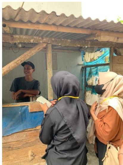
Gambar 12. Pelatihan Pembukuan terhadap UMKM Telur

Kegiatan ini bertujuan untuk membantu Pemilik UMKM Telur agar lebih mudah untuk mengatur keuangannya.