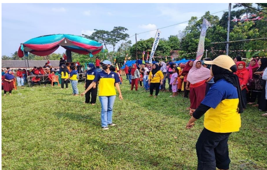
Gambar 16 . Berpartisipasi dalam memeriahkan Perlombaan HUT RI