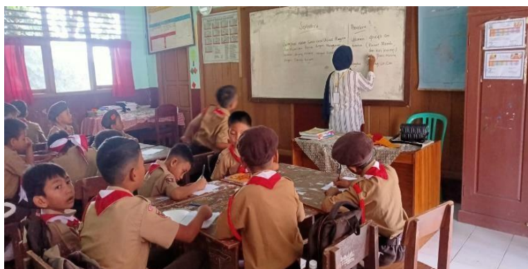
Gambar 10. Pemberian Materi

Kegiatan ini membantu para guru untuk memberikan ilmu kepada peserta didik di SDN 2 Galih Lunik.