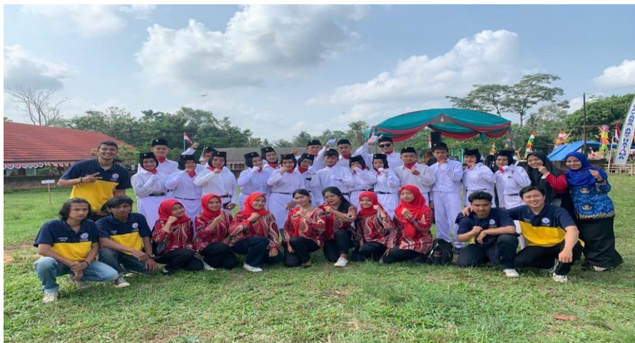
Gambar 15. Kegiatan mengikuti Upacara HUT RI