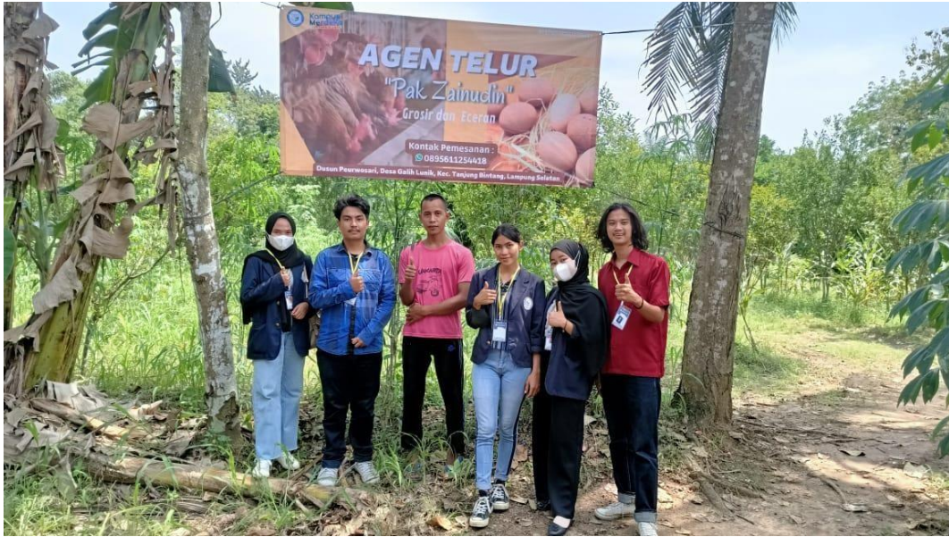
Gambar 13. Penyerahan benner UMKM Telur