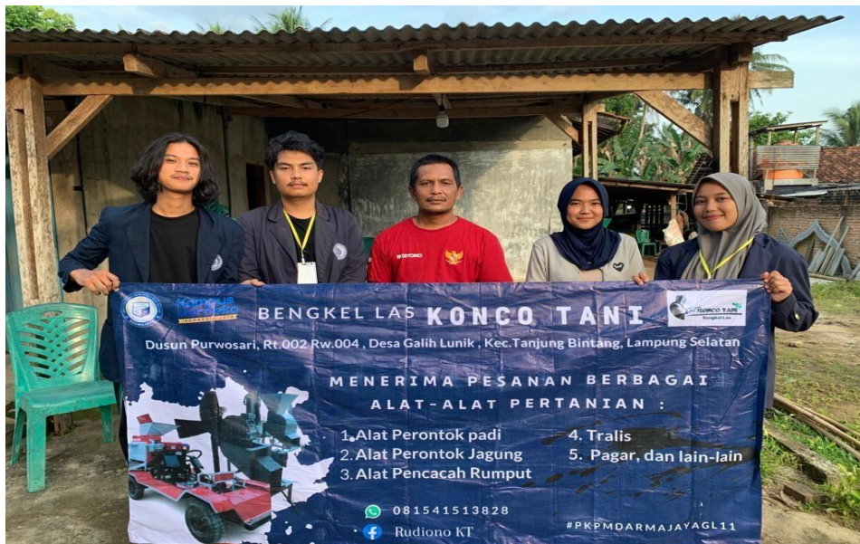
Gambar 7. Penyerahan Benner Bengkel Las