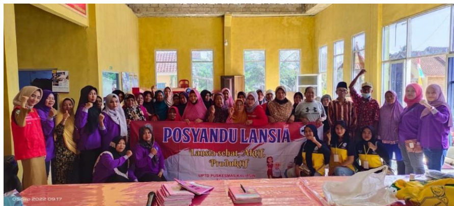
Gambar 18. Mengikuti Kegiatan Posyandu Lansia