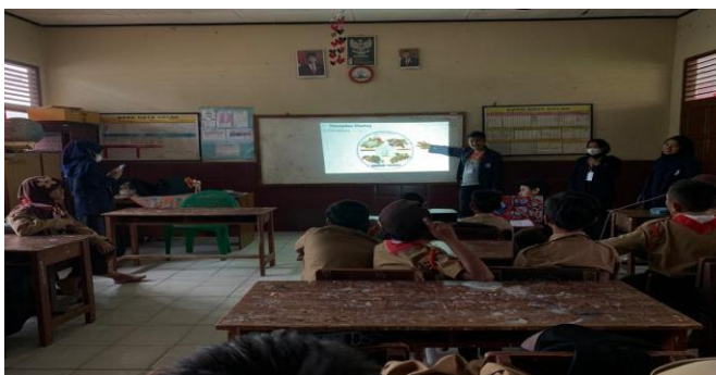
Gambar 2. Melakukan Sosialisasi Stunting

Dengan adanya program pemerintah mencegah stunting penulis membantu dengan menjelaskan kepada siswa/i SDN 2 Galih Lunik tentang pentingnya pencegahan stunting. Stunting adalah masalah kurang gizi kronis yang disebabkan oleh kurangnya asupan gizi dalam waktu yang cukup lama, sehingga mengakibatkan gangguan pertumbuhan pada anak yakni tinggi badan anak lebih rendah atau pendek (kerdil) dari standar usianya.