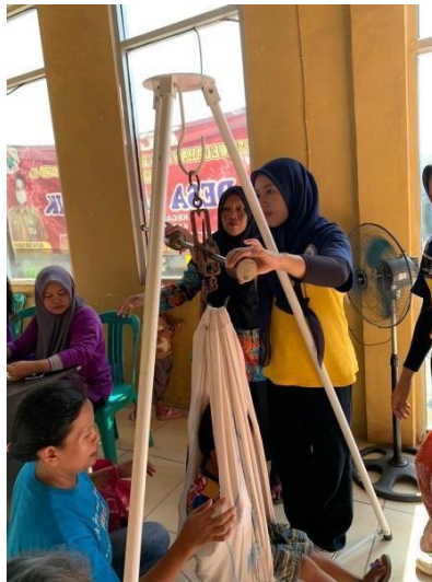
Gambar 17. Menimbang bayi pada kegiatan posyandu balita