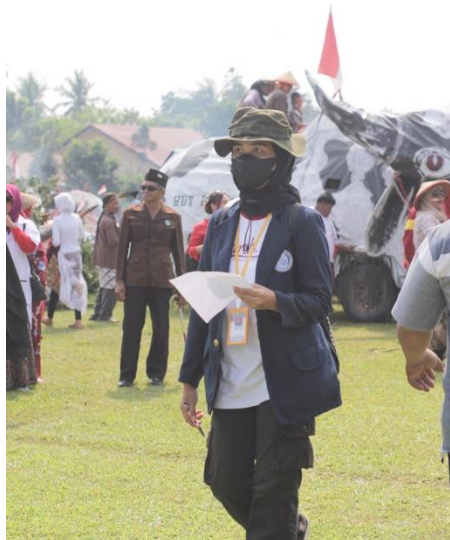
Gambar 2.6 Penjurian 17 Agustus