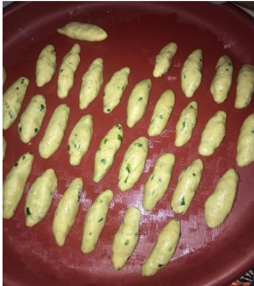
Gambar 2.1. Kegiatan Produksi Sempol Lele