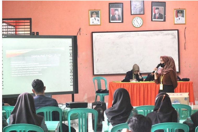
Gambar 2.5 Sosialisasi Di SMA