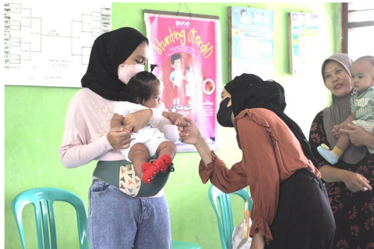
Gambar 2.4 Kegiatan Posyandu