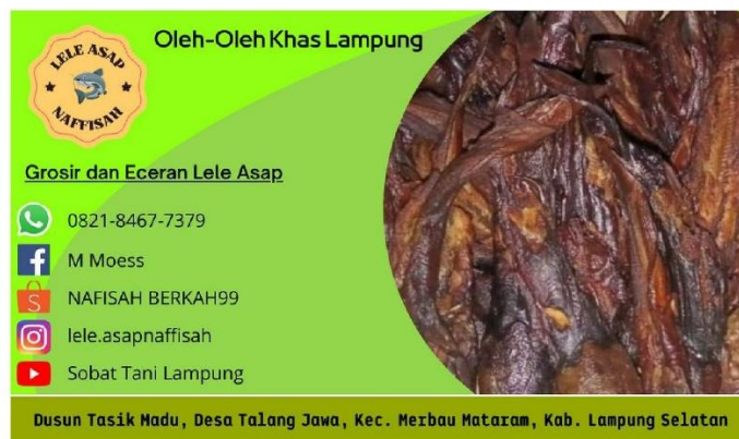
Gambar 2.9 Kartu Nama UMKM Lele Asap Naffisah