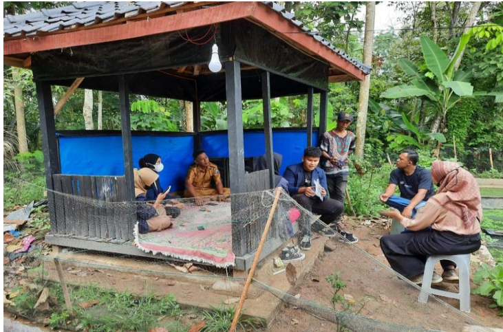
Gambar 2.3 Kegiatan Penerapan Pengetahuan Aplikasi Instagram