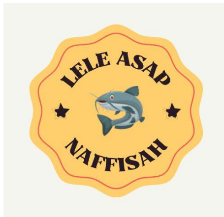
Gambar 2.8 Logo UMKM Lele Asap Naffisah

Logo, kartu nama, dan banner merupakan sebuah identitas usaha yang sangat bermanfaat bagi pelanggan untuk mengetahui informasi mengenai usaha tersebut.