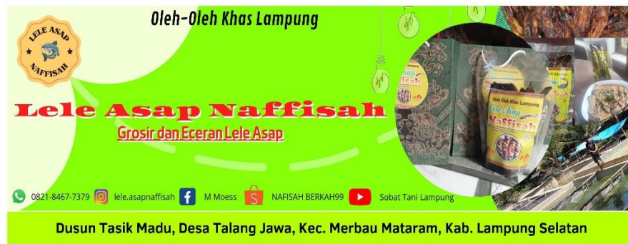
Gambar 2.10 Banner UMKM Lele Asap Naffisah