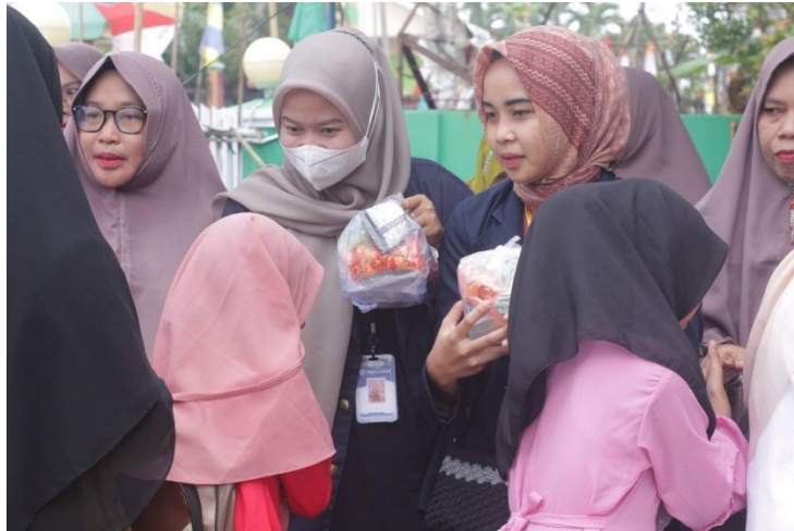
Gambar 2.7 Pengajian Rutin