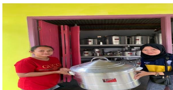
Gambar 2.1.7 pemasaran produk UMKM

Selain membuat logo untuk bisa dikenali masyarakat, mahasiswa PKPM Darmajaya ikut serta dalam memasarkan produk kepada Masyarakat.