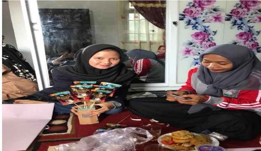
Gambar 2.1.9 melaksanakan pelatihan bucket snack

Melakukan pelatihan kewirausahaan kepada ibu-ibu TPKK membuat bucket bunga agar dapat menjadi peluang bagi ibu-ibu untuk membuka usaha sendiri dengan pelatihan ini pemberdayaan Pelaku pada sumber daya manusia dapat digunakan dengan baik.