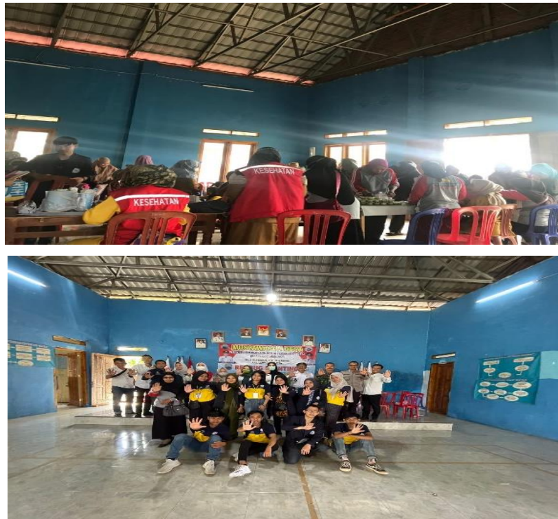
Gambar 2.1.8 melaksanakan kegiatan Posyandu Stunting

Melaksanakan dan membantu kegiatan posyandu bersama beberapa Nakes dan Aparat Desa Margodadi dengan Tema Stunting.