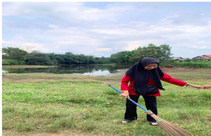
Gambar 2.1.10 Membersihkan Embung

Sesuai dengan Prokja dari kampus IIB Darmajaya yaitu terciptanya desa Pariwisata, salah satu asset wisata Desa Margodadi yaitu Embung, tetapi kurangnya kesadaran masyarakat dalam mengelolanya sekarang embung tersebut dibiarkan begitu saja dan masyarakat hanya mempergunakannya sebagai tempat pemancingan.