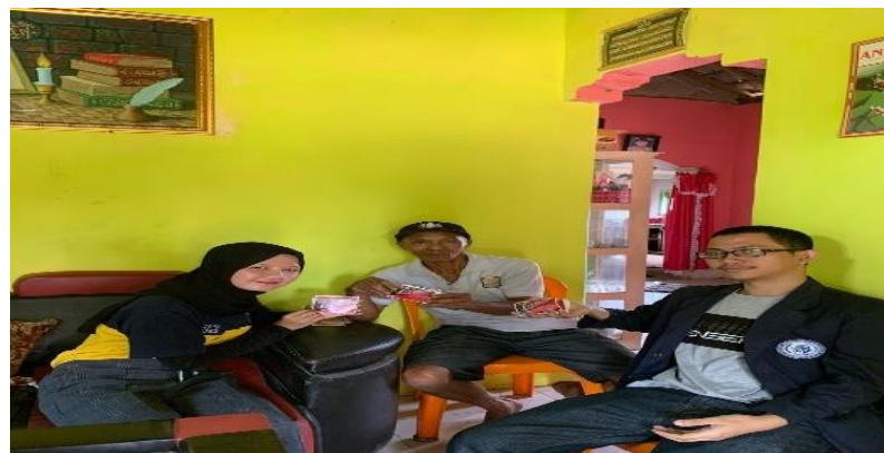
Gambar 2.1.6 penyerahan logo UMKM

Penyerahan logo pada produk UMKM Langsung Sunar Patri untuk siap dipasarkan secara luas.