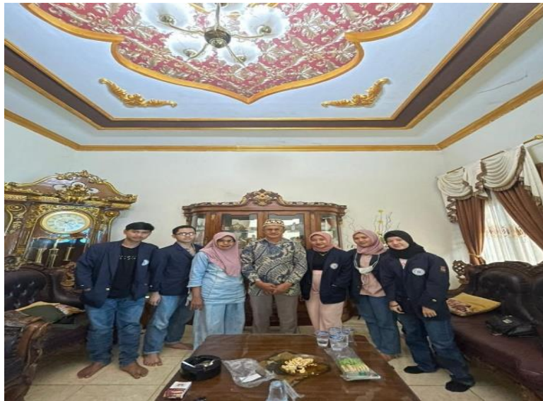
Gambar 2.1.1 Survey lokasi kegiatan PKPM dan izin menetap

Mencari tempat menetap untuk kegiatan PKPM di daerah Jati Agung, Lampung Selatan yang sesuai dengan UMKM yang diarahkan kampus dengan tema yakni “Pemberdayaan Masyarakat Melalui Semangat Merdeka Kampus Merdeka”.