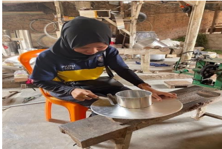
Gambar 2.1.3 Pembuatan produk UMKM

Salah satu hal yang harus dilaksanakan setelah melakukan kegiatan survey pada UMKM adalah membantu proses pembuatan produk salah satu dari beberapa macam produk lainnya yang dibuat dalam UMKM tersebut.