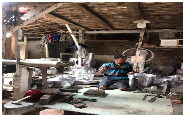
Gambar 2.1.2 Permohonan izin ke UMKM

Permohonan surat izin yang disampaikan kepada UMKM Langseng Sunar Patri, yang bertujuan untuk melaksanakan kegiatan PKPM yang di mulai dari tanggal 08 Agustus – 08 September 2022.