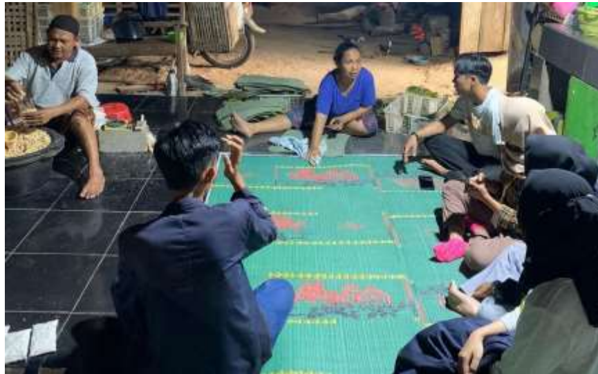
Gambar 1.1 Survei UMKM Tempe