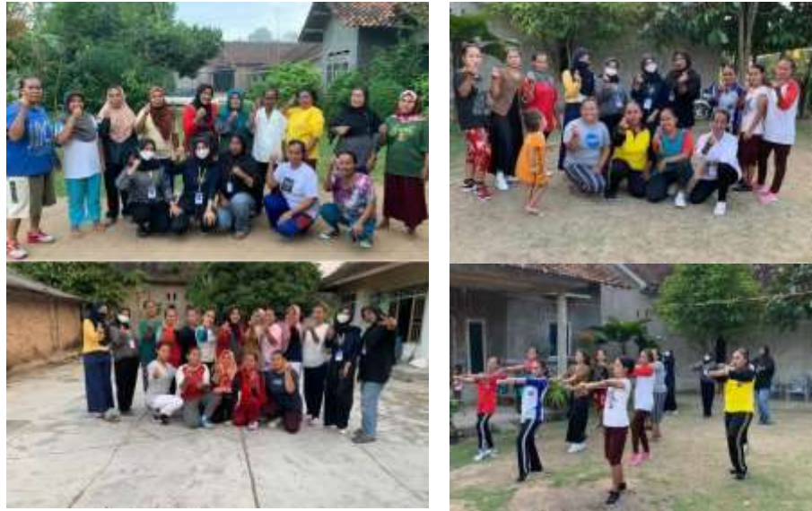
Gambar 1.21 Senam Bersama ibu-ibu dan lansia dusun Batu Agung dan Wonosari