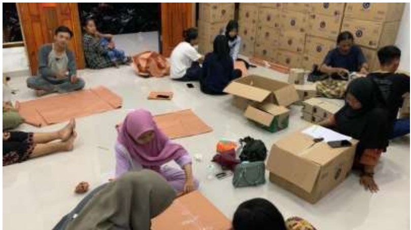
Gambar 1.18 pembungkusan hadiah