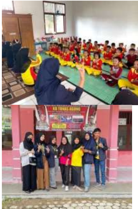
Gambar 1.29 Pendampingan pengajaran PAUD Tunas Agung

bersama anak-anak guna melatih konsentrasi, sosialisasi dan ketanggapan anak terhadap keadaan sekitar.