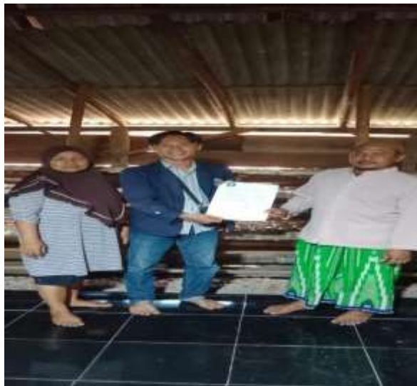
Gambar 1.2 Perizinan UMKM

Perizinan ini dilakukan guna silaturahmi dan meminta izin kepada UMKM bahwa akan menjadi mitra terkait saat pelaksanaan PKPM ini berlangsung di Batu Agung serta menjadi prioritas mitra saat kegiatan.