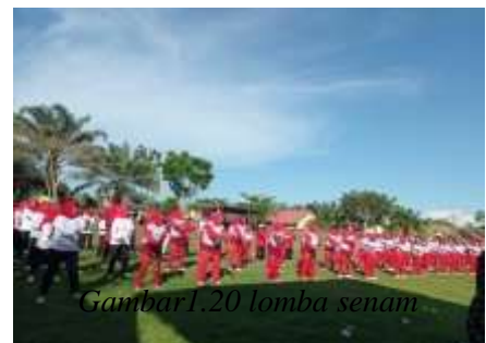
Gambar 1.20 lomba senam