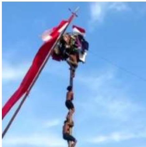
Gambar1.12 lomba panjat pinang

Serta pengadaan kegiatan perlombaan baik tingkat Rt, Dusun, instansi bahkan perorangan guna memeriahkan Kemerdekaan Indonesia yang memang sudah sangat dinantikan oleh warga desa Batu Agung karna beberapa tahun ini kita semua melakukan upacara bahkan perlombaan pun secara online karna dampak dari Covid-19 ini. Maka dari itu saat ini diadakan kegiatan yang sangat meriah di desa Batu Agung serta mengadakan pesta rakyat pada malam 17 agustus.