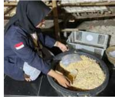
Gambar1.9 proses membungkus tempe