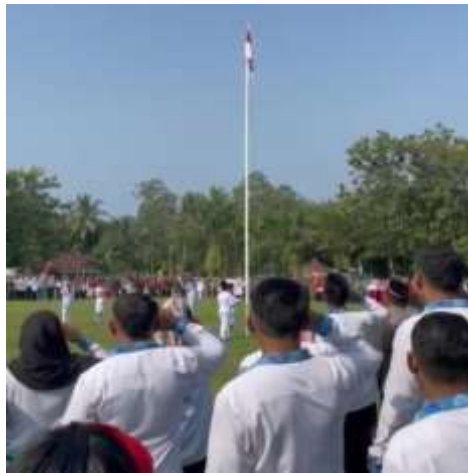
Gambar 1.13 upacara 17 an