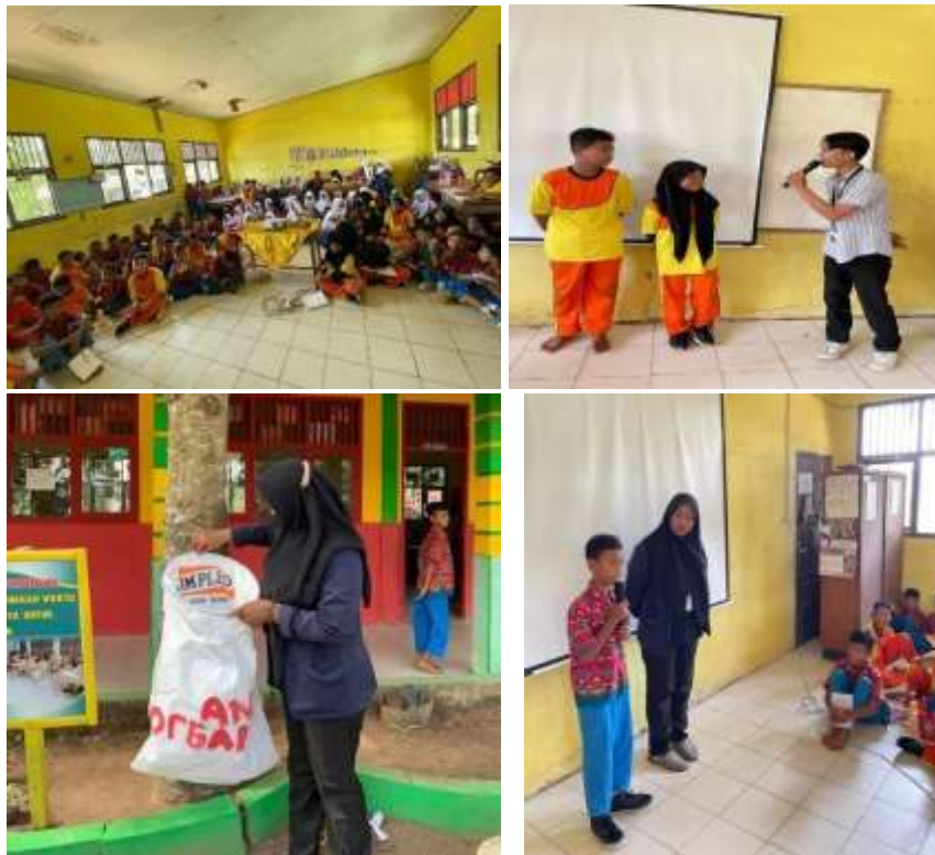
Gambar 1.28 Program kerja pendidikan di SD N 1 Batu Agung

Pada kegiatan ini selain menjalankan program kerja tentang pendidikan juga sebagai bentuk silaturahmi. Dalam kegiatan ini kami memberikan beberapa materi tentang kenakalan remaja, narkoba serta pembinaan kebersihan lingkungan dimana anak-anak kami ajarkan tentang pemilihan dan memisahkan sampah organik dan anorganik guna diciptakan nya Bank Sampah yang akan menghasilkan dana dari sampah yang ada.