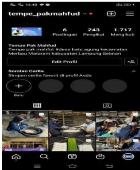
Gambar 5. Akun Instagram UMKM Tempe Pak Mahfud

Akun Instagram yang dibuat untuk menunjang pemasaran dan penjualan UMKM Tempe Pak Mahfud di beri nama akun @tempe_pakmahfud. Melalui akun Instagram yang dimiliki oleh UMKM Tempe Pak Mahfud kini produk UMKM ini telah memiliki 243 pengikut dan diprediksi akan terus meningkat apabila dapat dikelola dengan baik.