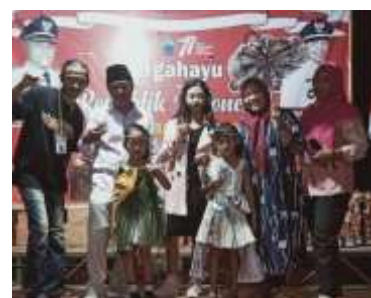
Gambar1.17 lomba fashion show