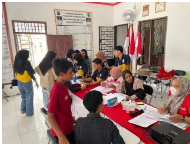
Gambar 1.26 Pengecekan Kesehatan