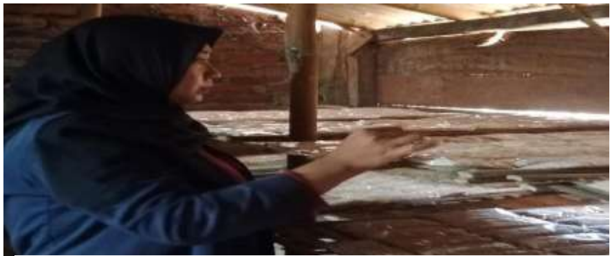
Gambar1.10 menata tempe yang elesai dibungkus