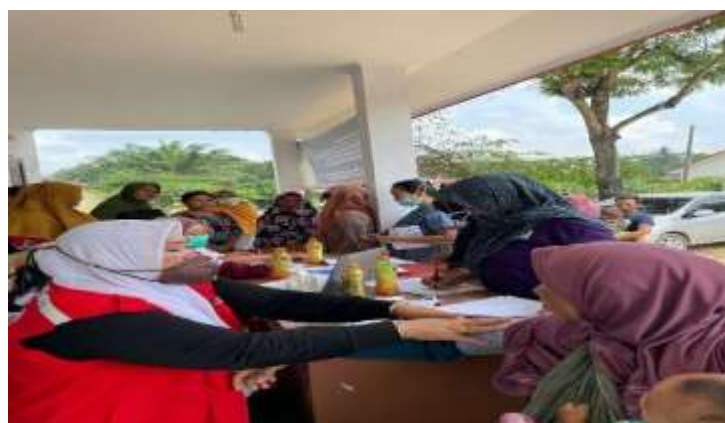
Gambar 1.27 Cek Golongan darah dan Cek HIV/AIDS