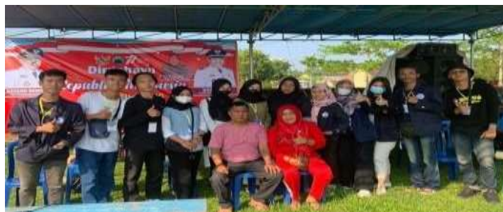
Gambar1.14 Panitia Perlombaan