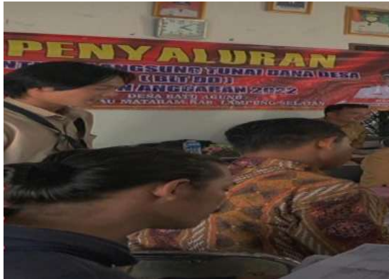
Gambar 1.25 Penyuluhan Kenakalan Remaja dan Narkoba