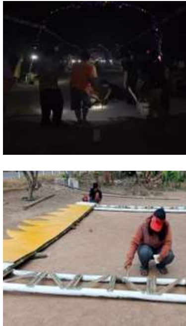
Gambar 1.30 Gotong royong serta pengecatan tugu dan gapura