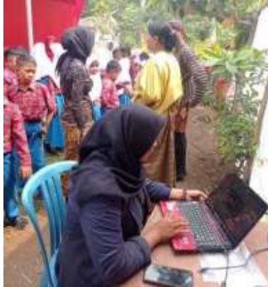
Gambar 1.24 Membantu Mengkoordinir acara pensi