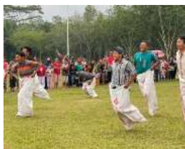
Gambar1.16 lomba balap karung