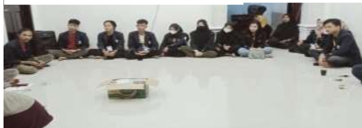
Gambar1.15 Rapat Kepanitiaan