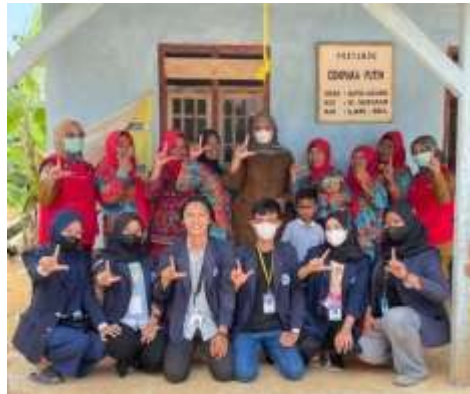
Gambar 1.22 Posyandu Anak