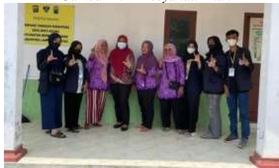
Gambar 1.23 Posyandu Lansia

2.3.9 Menghadiri dan membantu acara pensi SDN 1 Batu Agung Kegiatan ini merupakan kegiatan yang mendukung program merdeka belajar dimana mengasah kekreatifan anak dan bakat anak serta membantu sekolah menunjukkan kepada wali murid bahwa sekolah mampu mendidik anak-anak nya dengan baik dan berani menunjukkan bakat anak-anak di depan umum.