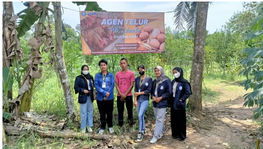
Gambar 2.14 Membuat Branding dan Banner