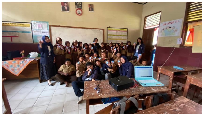
Gambar 2.6 Sosialisasi Stunting