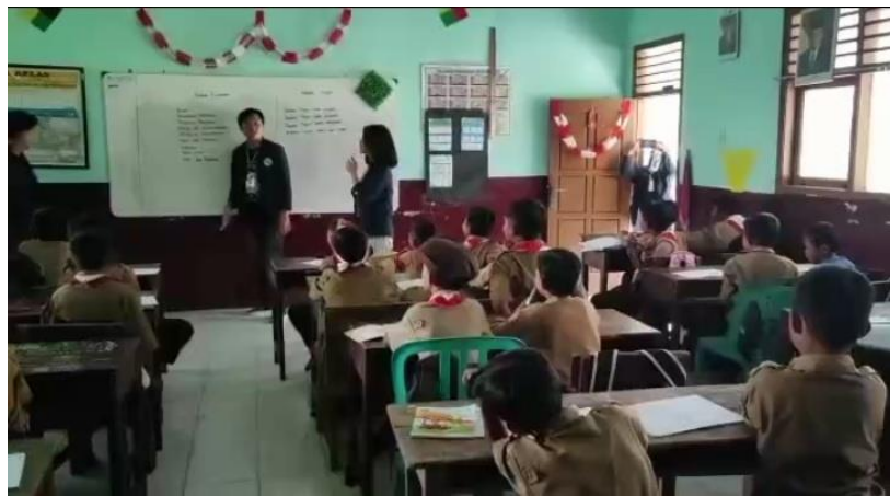
Gambar 2.10 Pemberian Materi