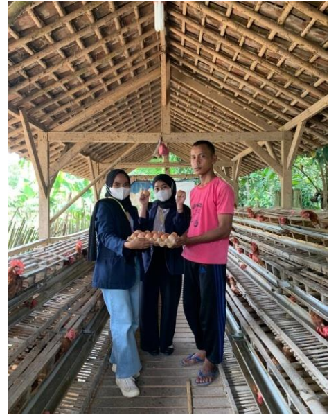
Gambar 2.13 Produk UMKM