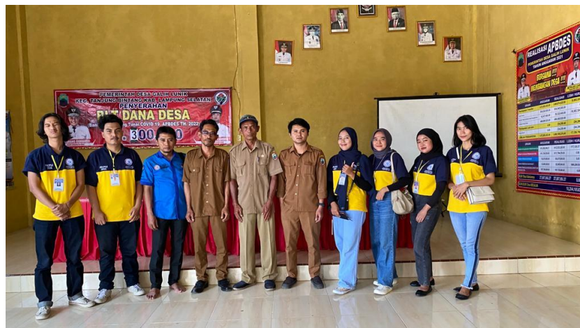
Gambar 2.2 Perizinan PKPM