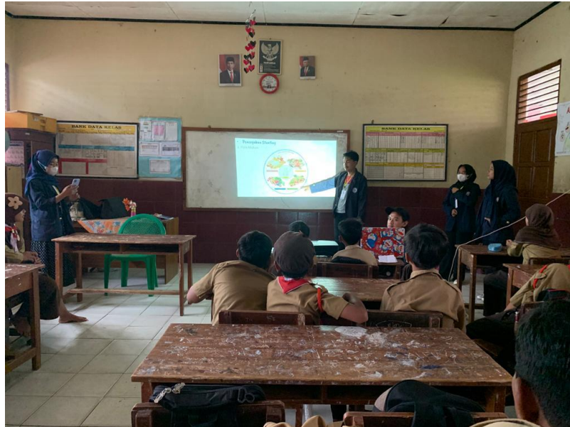
Gambar 2.5 Sosialisasi Stunting