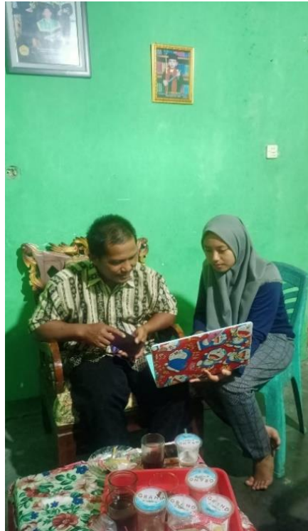
Gambar 2.7 Membuatkan Halaman Iklan Facebook