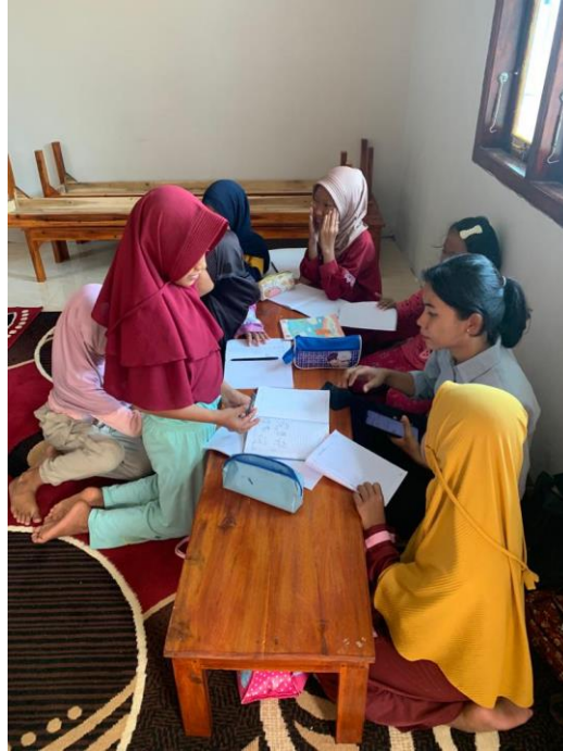
Gambar 2.3 Kegiatan Rumah Belajar Di Dusun Purwosari