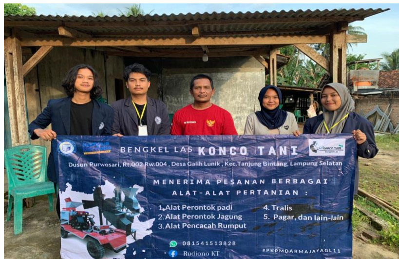
Gambar 2.8 Membuatkan Branding dan Banner