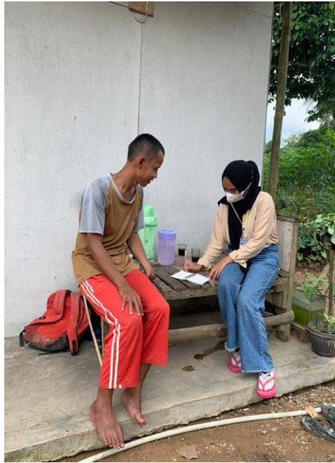
Gambar 2.12 Pelatihan Pembukuan