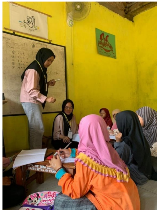
Gambar 2.4 Kegiatan Rumah Belajar Dusun Tambang Besi