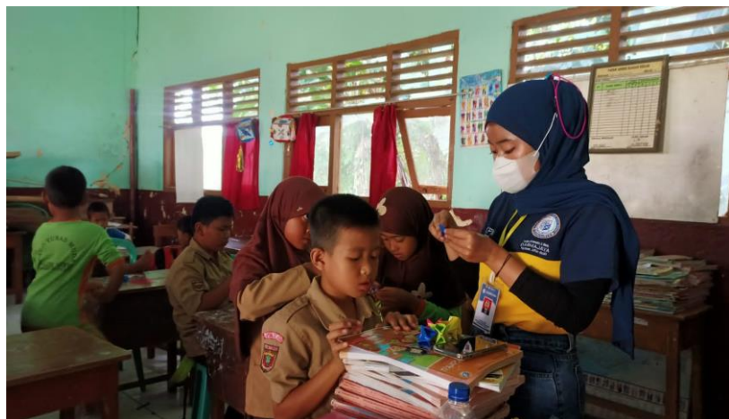
Gambar 2.11 Mengajarkan Kerajinan Tangan Origami