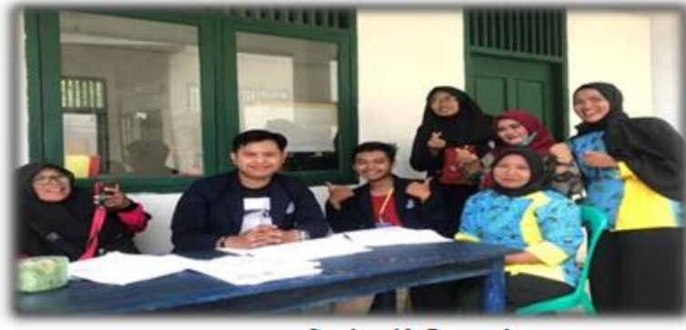
Gambar 12 Posyandu

merbau mataram. Pada posyandu tersebut semua balita harus melewati cek berat badan,tinggi badan, hingga suntik imunisasi.