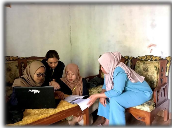
Gambar 6 Pelatihan Penggunaan Manfaat Facebook