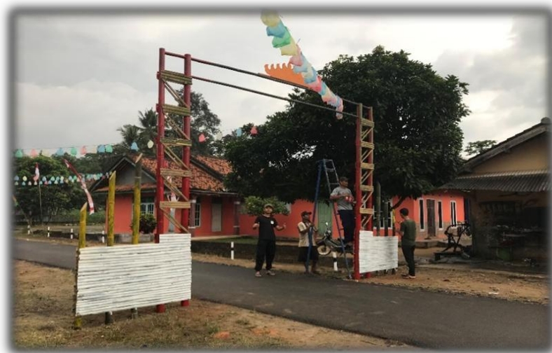
Gambar 13 Membuat Gapura

Membantu membuat dan mendirikan gapura PKPM Darmajaya atau HUT NKRI yang ke-77 sebagai kenang-kenangan untuk Desa dari.