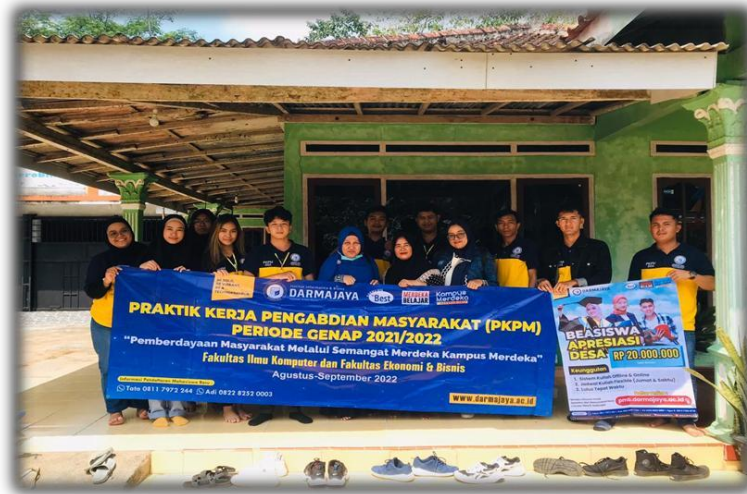
Gambar 9 Pelepasan Peserta PKPM IIB Darmajaya

Pelepasan ini adalah awal kegiatan PKPM yang didampingi langsung oleh Dosen Pembimbing Lapangan dan mengantarkan Mahasiswa ke Posko PKPM di desa Sinar karya kecamatan Merbau mataram kabupaten Lampung selatan.