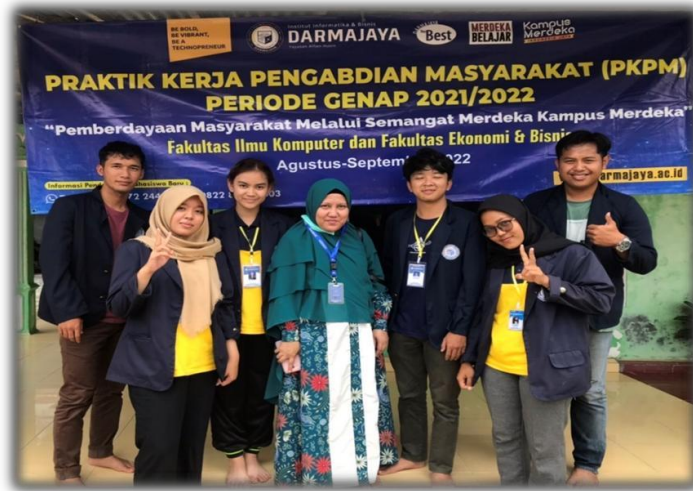
Gambar 18 Kunjungan Dosen DPL

Kunjungan dosen pembimbing lapangan ini untuk melihat seberapa jauh progress mahasiswa PKPM Darmajaya di desa Sinar karya mengenai UMKM.