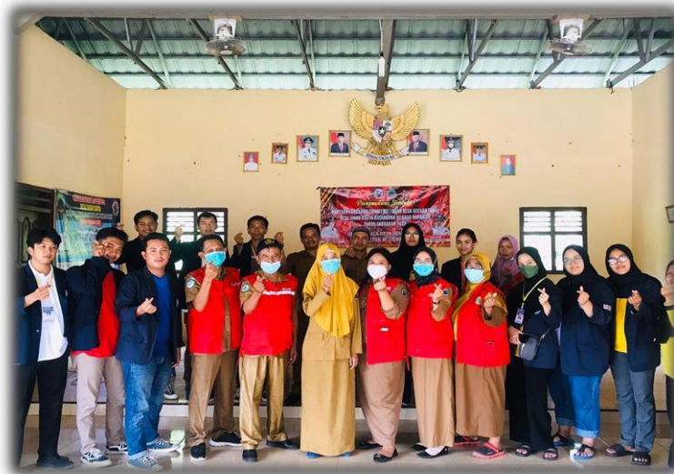
Gambar 19 Membantu Kegiatan Vaksinasi

Membantu kegiatan vaksinasi di Balai Desa bersama Aparatur desa dan Tenaga kesehatan.