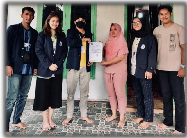
Gambar 3 Permohonan Surat Izin ke UMKM