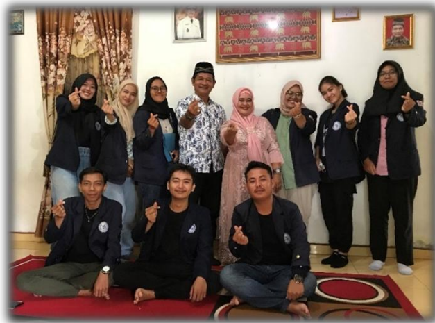
Gambar 2 Survey Lokasi dan Izin Menetap

Mencari tempat menetap untuk kegiatan PKPM di daerah Merbau Mataram, Lampung Selatan yang sesuai dengan UMKM yang diarahkan kampus dengan tema yakni “Pemberdayaan Masyarakat Melalui Semangat Merdeka Kampus Merdeka”.