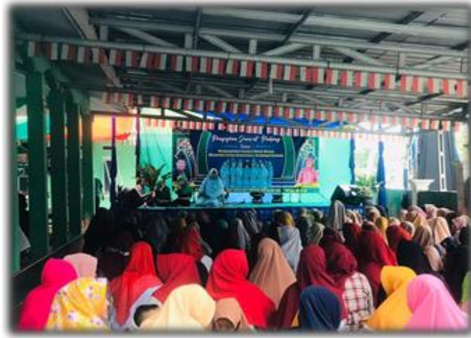
Gambar 16 Pengajian

Mengikuti pengajian jum'at pahing yang diadakan rutin 3 minggu sekali di dusun pendowoharjo.