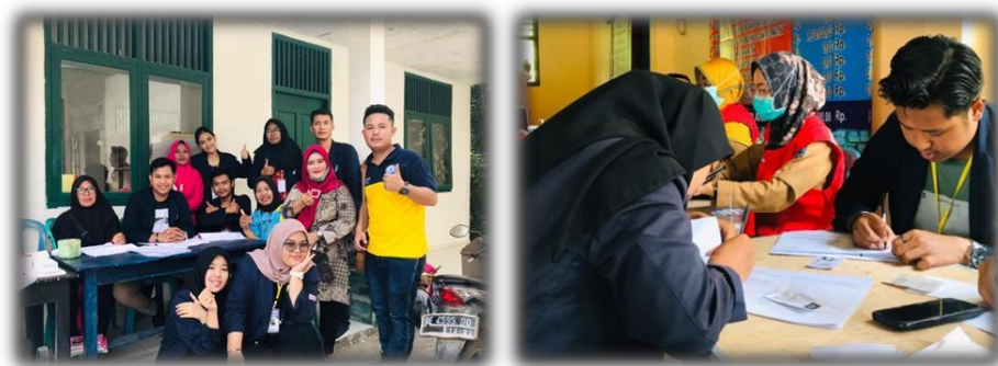
Gambar 8 Melaksanakan Posyandu Tengan Tema Stunting

Stunting adalah masalah gizi kronis akibat kurangnya asupan gizi dalam jangka waktu panjang sehingga mengakibatkan tegangannya pertumbuhan pada anak. Stunting juga menjadi salah satu penyebab tinggi badan anak terhambat, sehingga lebih rendah dibandingkan anak-anak seusianya.