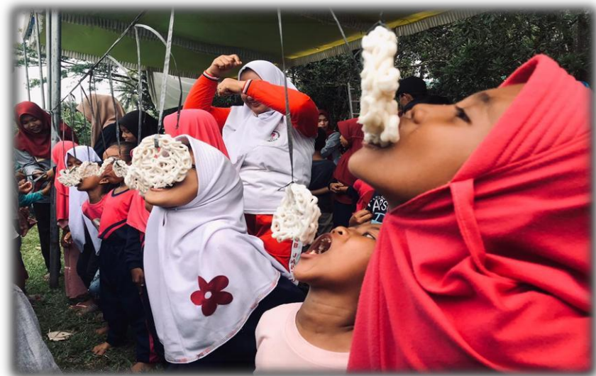
Gambar 15 Perlombaan-Perlombaan

Membantu dan Memeriahkan Acara Lomba Upacara Hari Ulang Tahun Republik Indonesia yang ke 77 di lapangan desa Sinar karya.