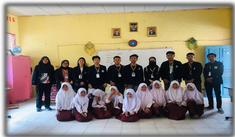
Gambar 11 Observasi Ke Sekolah Dasar

Observasi dilakukan untuk memperkenalkan mahasiswa PKPM Darmajaya kepada murid-murid dan guru-guru di SD Sinar karya agar tali silaturahmi kami semakin luas di desa Sinar Karya.