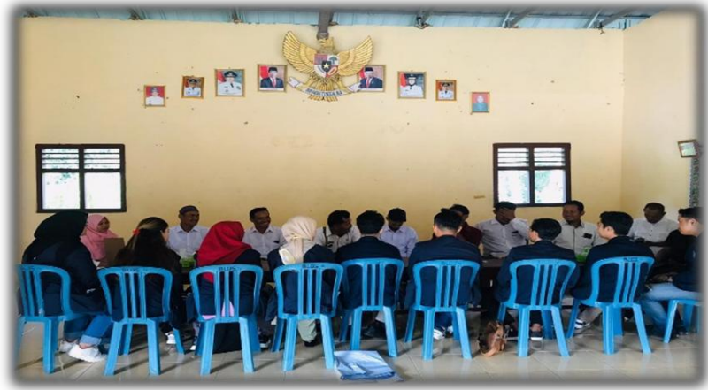
Gambar 10 Silaturahmi Ke Balai Desa