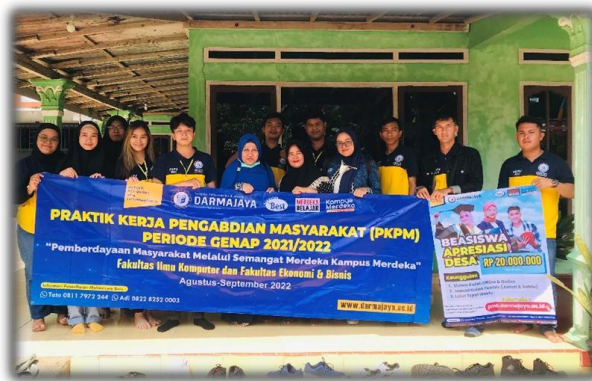
Gambar 4 Pelepasan Peserta PKPM

Salah satu hal yang harus dilaksanakan ketika sudah menyelesaikan kegiatan PKPM dan berpamitan kepada perangkat desa serta pihak UMKM dan berterimakasih telah diizinkan melaksanakan kegiatan di daerah tersebut.