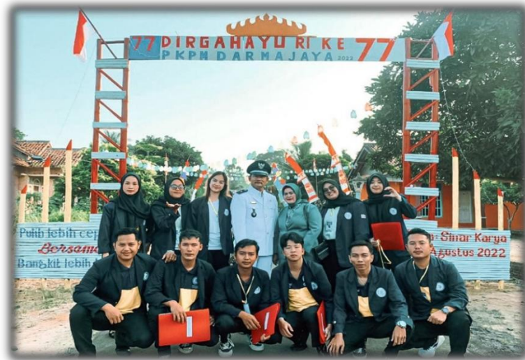
Gambar 14 Upacara HUT NKRI Yang ke-77