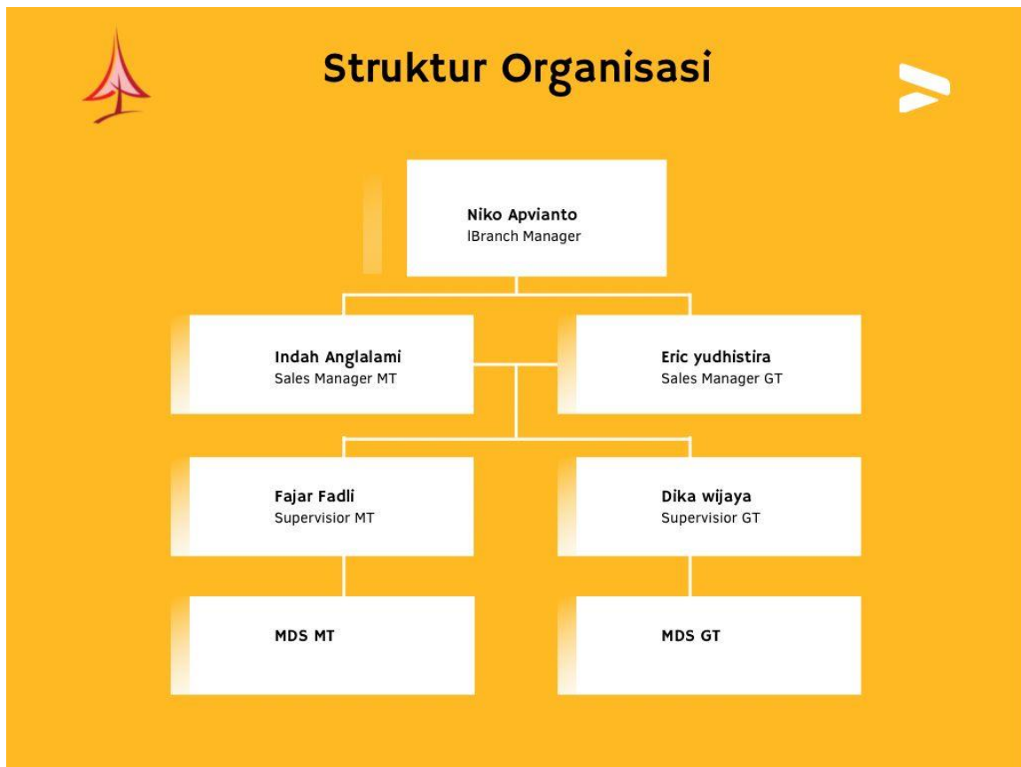
Gambar 4 : Struktur Organisasi Perusahaan