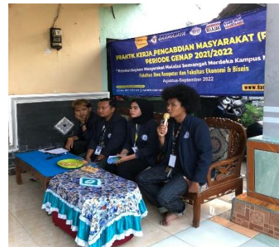
Gambar 2.2. Pembinaan digital marketing kepada pelaku UMKM