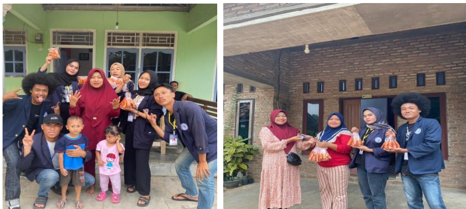
Gambar 2.8. Membantu memasarkan kerupuk seblak

Dalam kegiatan ini saya membantu memasarkan dengan mencoba menjual kepada rekan-rekan sesama seperjuangan PKPM serta kepada masyarakat sekitar.