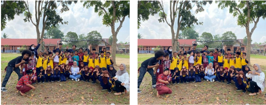
Gambar 2.14. Membantu mengajar di SDN 1 Sinar Rejeki

Salah satu tujuan dalam PKPM adalah memberikan Pendidikan, yang dimana kali ini kami memberikan pengetahuan materi kepada siswa-siswi yang ada di SD 1 Sinar Rejeki Kecamatan Jati Agung, Kabupaten Lampung Selatan, Lampung 35357. Dalam kegiatan ini saya membantu kegiatan belajar mengajar di SDN tersebut dengan alasan agar memudahkan kegiatan belajar mengajar disana.