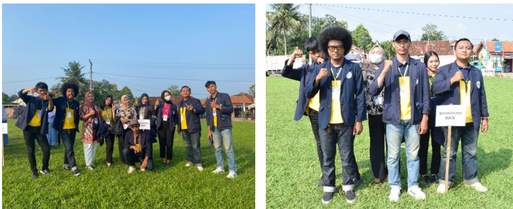
Gambar 2.11. Partisipasi dalam Kegiatan Upacara di Desa

Upacara adalah pelaksanaan peringatan Hari Kemerdekaan Bangsa Indonesia atau biasa dikenal dengan Tujuh Belasan yang dilaksanakan setiap tahunnya pada tanggal 17 Agustus. Rakyat Indonesia merayakan dan mensyukuri Peringatan Kemerdekaan Bangsa Indonesia dengan meriah, mulai dari melaksanakan upacara bendera hingga melakukan berbagai macam perlombaan. Salah satunya yang dilakukan oleh masyarakat Desa Sinar Rejeki dan sekitarnya yang melaksanakan Upacara di Lapangan Balai Desa Sinar Rejeki Kecamatan Jati Agung Kabupaten Lampung Selatan.