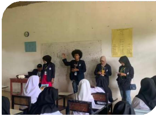
Gambar 2.16. Sosialisasi Literasi Digital di SMK Gema Karya