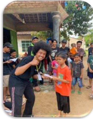
Gambar 2.12. Partisipasi dalam Kegiatan Lomba di Desa Sinar Rejeki