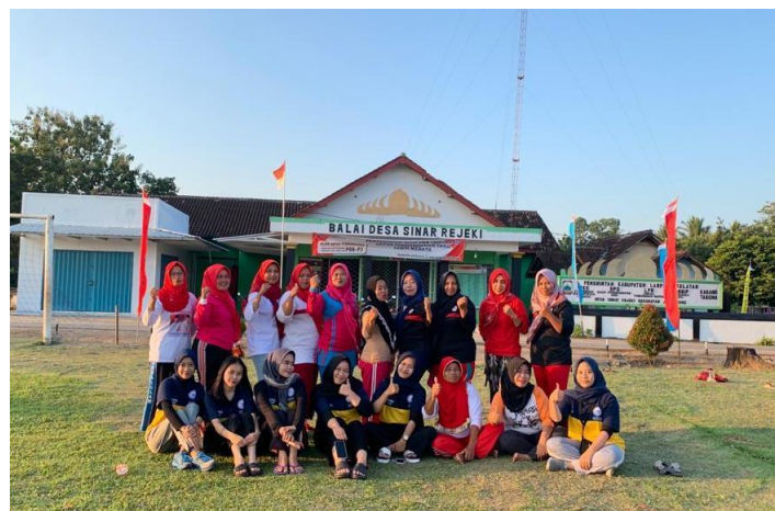
Gambar 2.13. Partisipasi dalam kegiatan Senam Rutin Ibu Pkk

Senam adalah salah satu di antara cabang olahraga yang melibatkan beberapa gerakan tubuh serta membutuhkan kecepatan, kekuatan, dan keserasian gerakan fisik. Senam dapat membantu seseorang untuk meningkatkan kebugaran jasmani, mengembangkan keterampilan, serta menanamkan nilai mental spiritual kepada individu yang melakukannya. Selain itu menurut Mahendra (2000) Senam adalah kegiatan utama yang paling bermanfaat dalam mengembangkan komponen fisik dan kemampuan gerak (motorability). Kegiatan senam ini dilaksanakan pada Hari Senin 8 Agustus 2022 waktu pertama datang ke Desa bersama Ibu-Ibu Pkk.