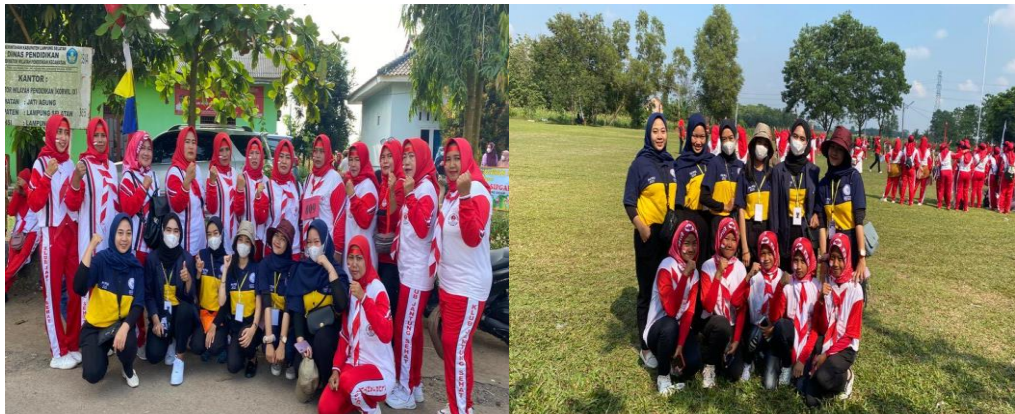
Gambar 2.9. Lomba Senam Jantung Sehat

tentang pentingnya sarapan pagi dan manfaatnya dalam menjalani kegiatan sehari-hari.