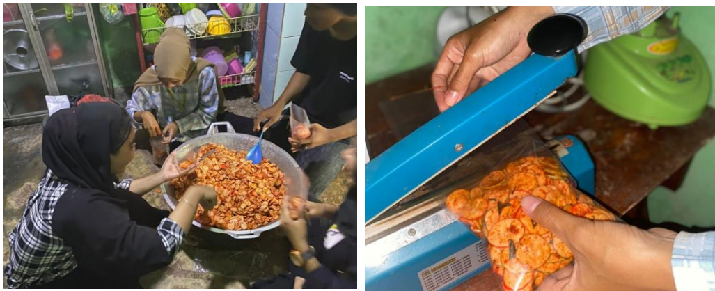
Gambar 2.6. pembuatan serta pengemasan kerupuk seblak