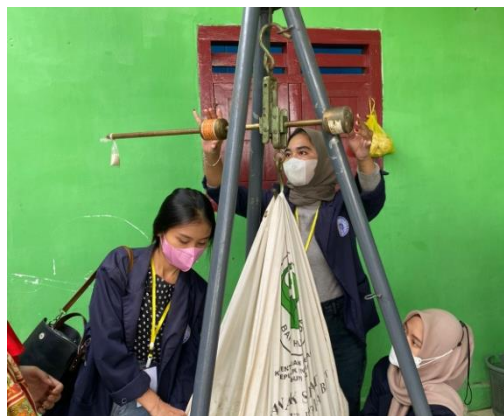
Gambar 2.10. Partisipasi dalam kegiatan Posyandu

Posyandu adalah jenis pelayanan kepada anak berupa penimbangan untuk memantau pertumbuhan anak. Manfaat dari kegiatan posyandu adalah memberikan layanan Kesehatan ibu dan anak, KB, Imunisasi, Gizi, dan Penanggulangan diare. Adapun tujuan dari kegiatan Posyandu adalah untuk menurunkan angka kematian bayi (AKB), angka kematian ibu (Ibu Hamil), melahirkan dan nifas. Seperti yang dilakukan pada Desa Sinar Rejeki Kecamatan Jati Agung, Lampung Selatan yang rutin melakukan kegiatan posyandu pada tanggal 16 Agustus 2022. Pada Kegiatan Posyandu rutin ini tidak hanya anak-anak saja akan tetapi juga wanita yang sudah lanjut usia. ergizi.