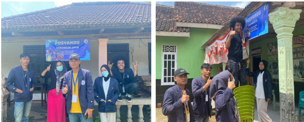
Gambar 2.15. Pemasangan Banner Posyandu