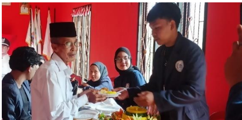
Gambar. 29 Acara perpisahan bersama Aparat Desa