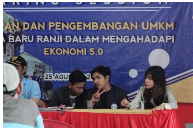
Gambar. 21 Sharing Session