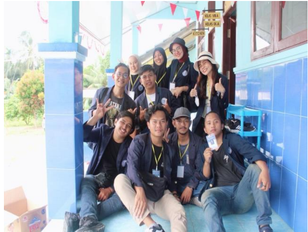
Gambar. 23 Kunjungan ke PGRI