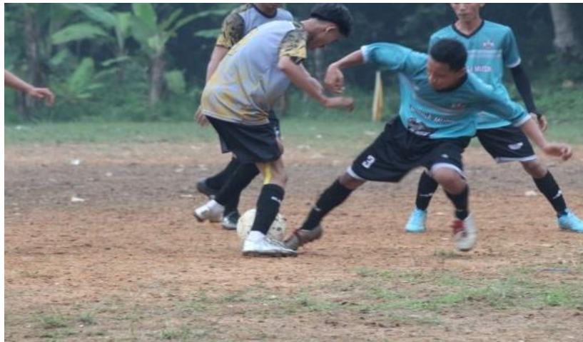
Gambar. 28 Keanitian dokumentasi Liga Desa