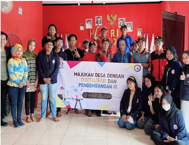
Gambar. 22 Suasana selesai penyuluhan