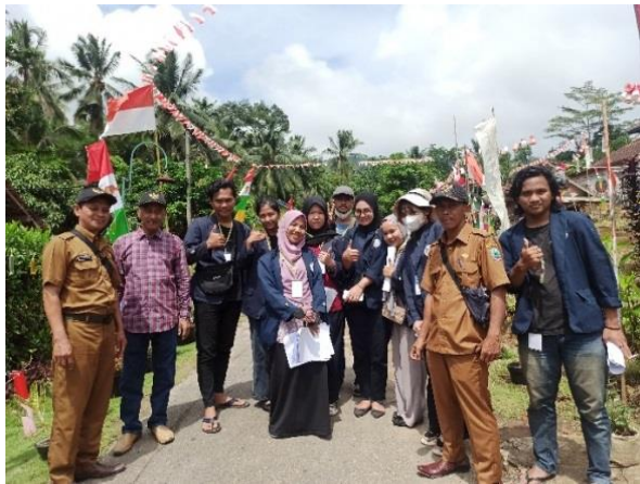
Gambar. 27 Panitia 17 Agustus di Dusun PKPM dalam lomba adipura