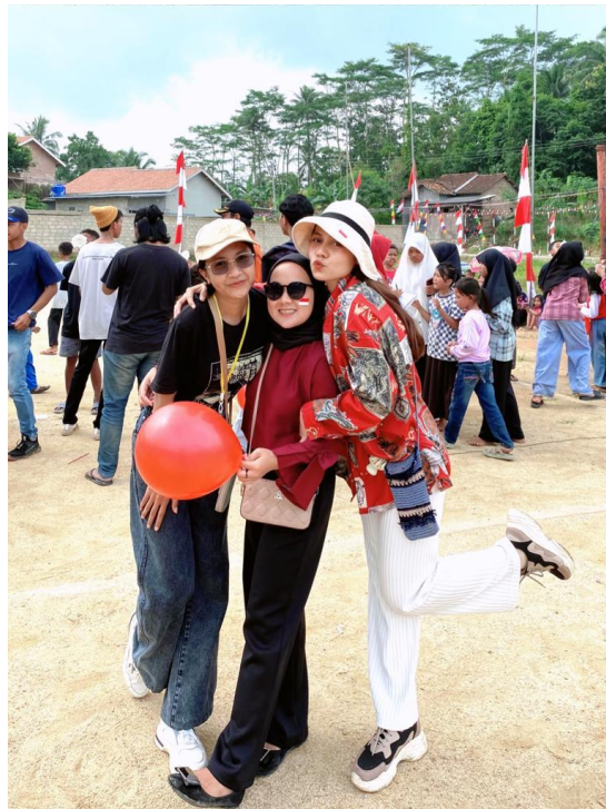
Gambar. 19 Suasana 17 Agustus