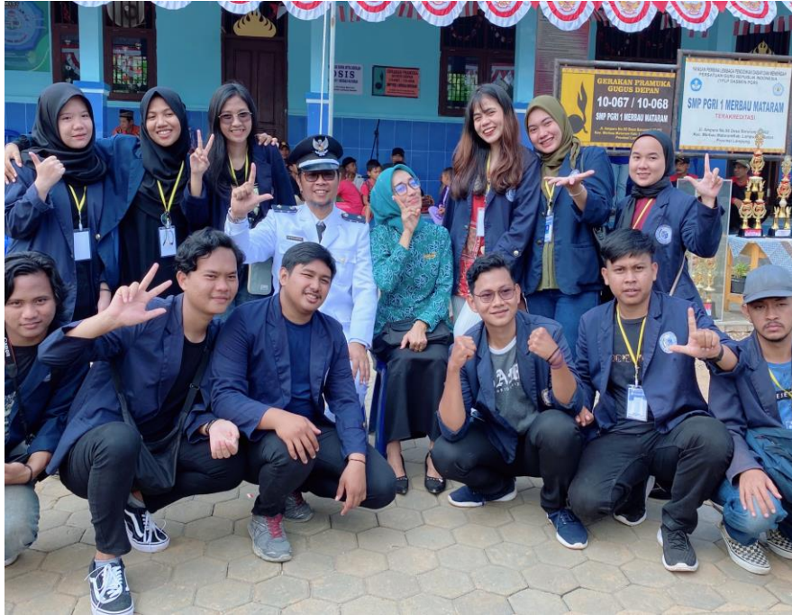
Gambar. 18 upacara 17 Agustus 2022