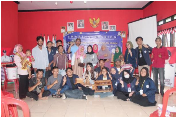
Gambar .20 Suasana selesai sharing session