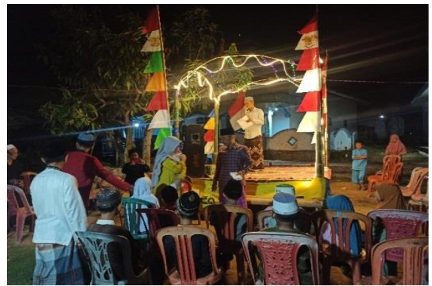
Gambar. 26 Penilaian 7 Dusun oleh mahasiswa