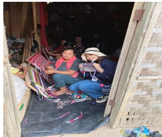
Gambar. 25 Pengerajin keset