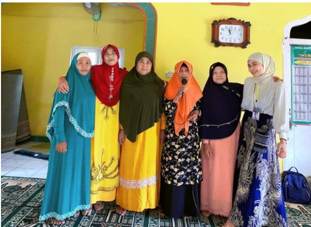
Gambar. 24 Pengajian di Dusun Pilar