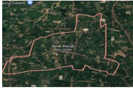
Gambar 1.1 Peta Sinar Karya