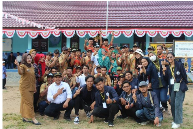
Gambar2.14 Upacara 17 Agustus di SMP PGRI dan Foto Bersama