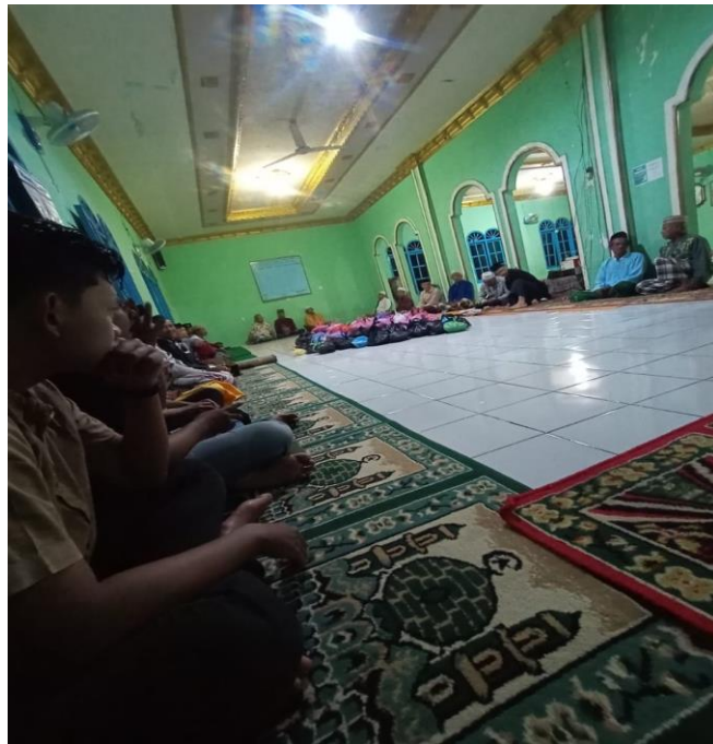
Gambar2.21 Kegiatan Pengajian Bapak-Bapak