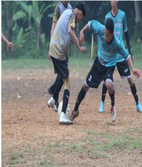
Gambar2.24 Dokumentasi Liga Desa