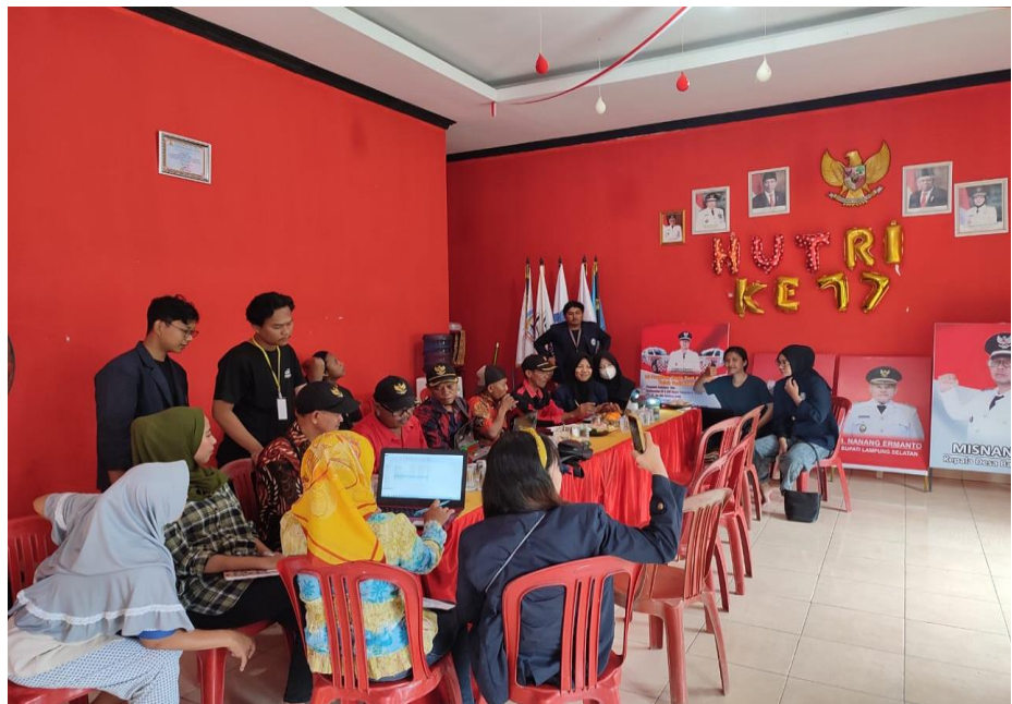
Gambar2.13 Pelatihan IT Bersama Aparatur Desa