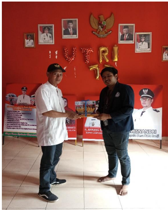
Gambar2.25 Acara perpisahan bersama aparat desa dan penyerahan plakat