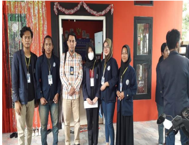
Gambar2.26 Kunjungan Dewan Pembimbing Lapangan ke Balai Desa