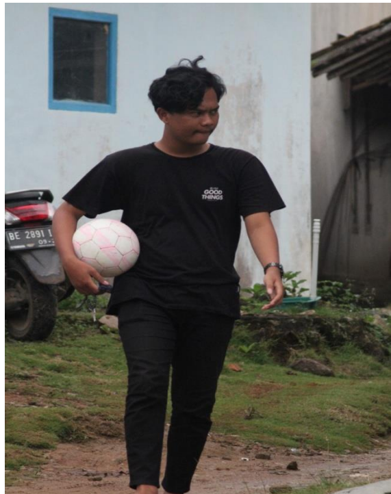
Gambar2.23 Kepanitiaan Sepak Bola Liga Desa