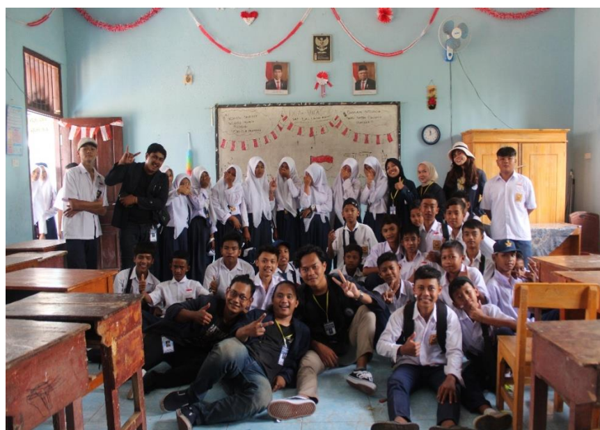
Gambar2.11 Kunjungan SMP PGRI Desa Baru Ranji