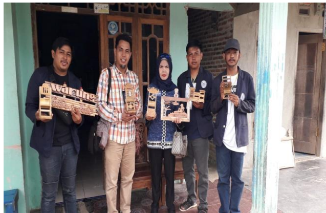
Gambar2.27 Kunjungan Dewan Pembimbing ke UMKM Kayu