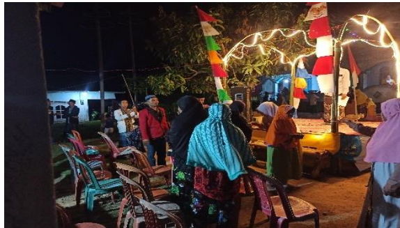
Gambar2.17 Pembagian Santunan Lansia diDusun Pilar