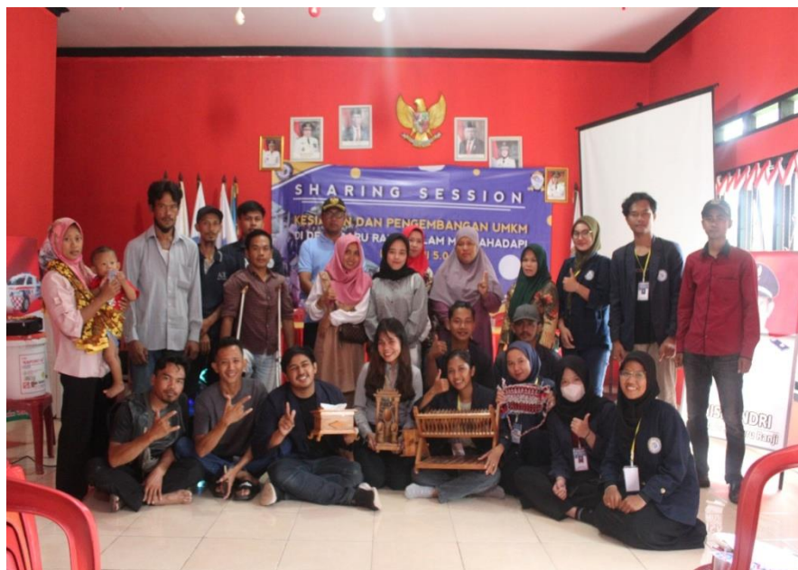
Gambar2.10 Sharing Session UMKM