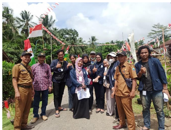
Gambar2.15 Penilaian 7 Dusun Oleh Mahasiswa PKPM Dalam Lomba Adipura