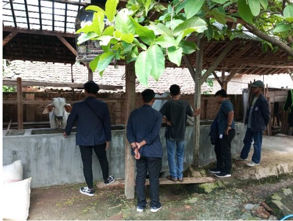
Gambar2.20 Kunjungan Peternakan Sapi