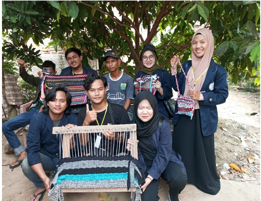
Gambar2.12 Hasil Kerajinan Keset