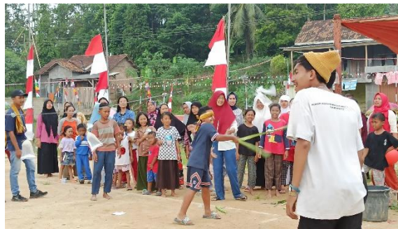
Gambar2.18 Kepanitiaan Lomba 17 Agustus di Desa Baru Ranji