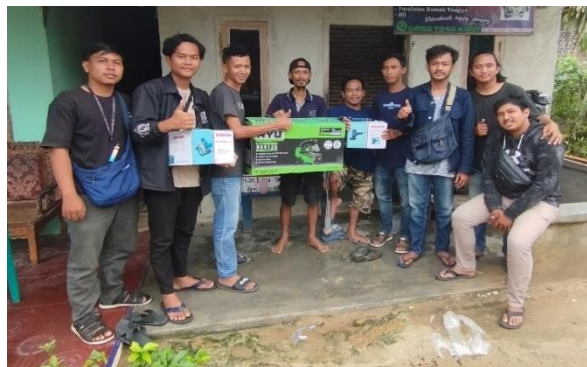
Gambar2.19 Penyerahan Alat Pada UMKM Kayu