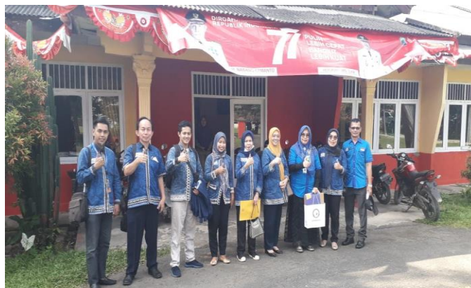
Gambar2.28 Penjemputan Mahasiswa PKPM Di Kantor Kecamatan Merbau Mataram