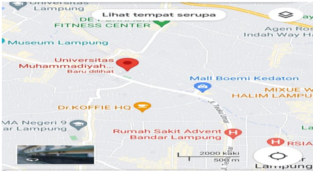
Gambar 2.1 Lokasi Instansi

Kode PT : 01002 Status PT : Aktif Akreditasi : (B) Tanggal Berdiri : 24 April 1987 Nomor SK PT : 607/KPT/2017 Tanggal SK PT : 31 Oktober 2017 Alamat : Jalan ZA Pagaralam No. 14 Kota/Kabupaten : Kec. Kedaton -Kota BandarLampung-Prov. Lampung Kode Pos : 35142 Telepon : 0721-701246-705178 Faksimil : 0721-701246 Surel : um_lampung@yahoo.co.id