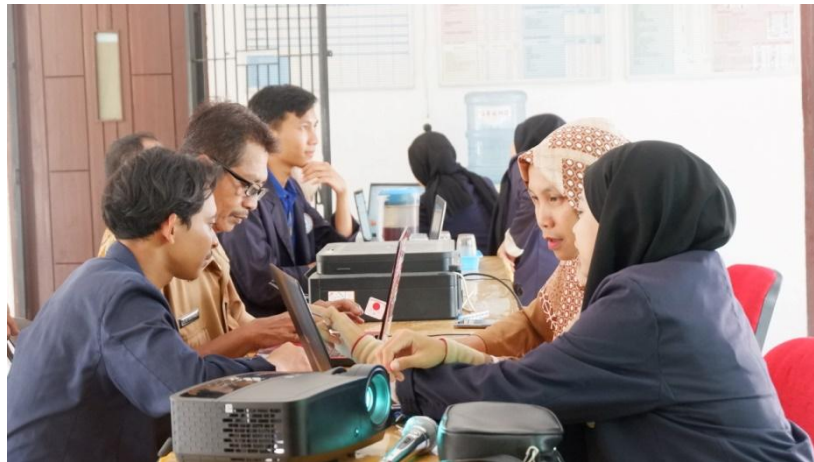
Gambar 1.22 Pelatihan Microsoft Word

Mengadakan pelatihan dasar Microsoft Word kepada Aparatur Desa Margo Mulyo guna menyalurkan ilmu yang sudah di dapatkan selama di perkuliahan serta bertujuan untuk meningkatkan kualitas sumber daya manusia (Aparatur Desa).