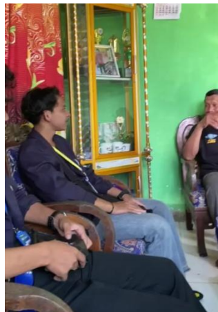
Gambar 1.2 Foto Pemilik UMKM

Mengunjungi lokasi pembuatan Salai Pisang Dan Bakpao untuk kebutuhan informasi terkait UMKM mulai dari harga jual, kemasan yang digunakan serta pemasaran.