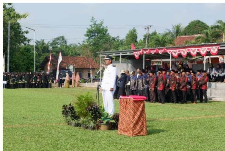
Gambar 1.10 Mengikuti Upacara

Menjadi peserta upacara dalam rangka memperingati Hut RI ke 77 di lapangan desa Margo Mulyo serta berpartisipasi sebagai panitia dalam acara lomba.