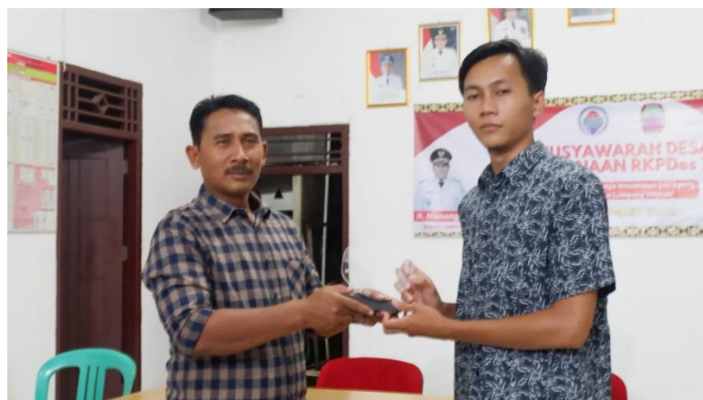
Gambar 1.22 Penyerahan Pelakat

Acara pelepasan dilaksanakan malam hari dan diadakan acara makan bersama dengan Aparatur Desa Margo Mulyo, Pemuda serta Pamong Desa di Balai Desa Margo Mulyo, dan memberikan kenang-kenangan berupa Pelakat.