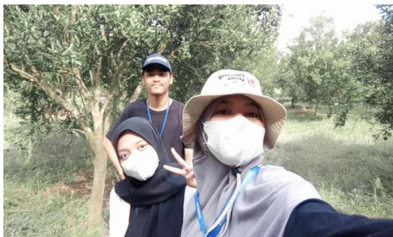
Gambar 1.8 Foto Di Kebun Jeruk BW

Berkunjung ke kebun jeruk BW milik warga desa Margo Mulyo untuk melihat potensi pariwisata yang bisa di kembangkan.