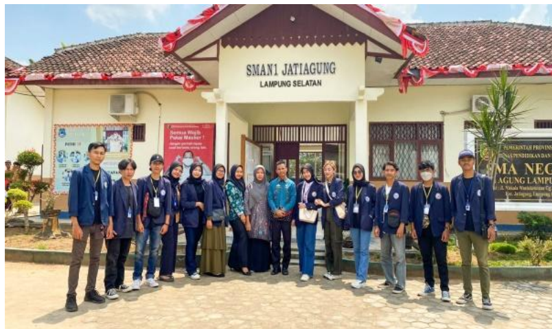
Gambar 1.5 Berkunjung Ke SMA N 1 Jati Agung

Kegiatan ini bertujuan untuk memperkenalkan kampus IIB Darmajaya ke siswa siswi Sma N 1 Jati Agung khususnya kelas XII yang nantinya akan melanjutkan pendidikannya ke perguruan tinggi dan memberikan sedikit motivasi betapa pentingnya pendidikan.