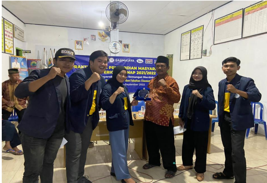
Gambar 2.1 Pengenalan Anggota Kelompok 31 Di Balai Desa