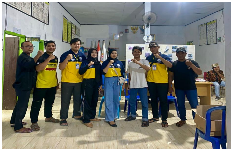
Gambar 2.3 Pembentukan Karang Taruna di Desa Sidomukti

Melakukan pengenalan pada seluruh karang taruna Desa Sidomukti yang sempat tidak aktif selama pandemi sebagai anggota kelompok 31 peserta PKPM IIB DARMAJAYA dan merekomendasikan hingga sudah terbentuknya struktur baru karang taruna Desa Sidomukti guna ikut serta dalam pelaksanaan program kerja lainnya.