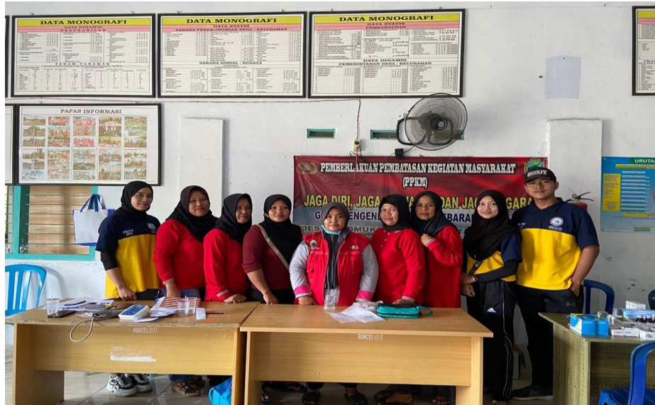
Gambar 2.2 Program Kerja di Desa Sidomukti