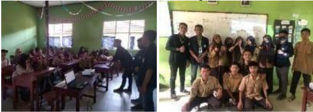
Gambar 7. Sosialisasi Literasi Digital di SMP

norma baik saat menginspirasi pendapat di media sosial. Membuat type password dengan kekuatan serta melindungi data pribadi dari setiap ancaman berbahaya bermedia digital.