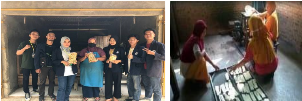
Gambar 3. Sosialisasi UMKM

Pengelolaan UMKM dapat memahami bagaimamna mengelola pemasaran untuk dapat di distribusikan produk agar sampai ke keluar dari desa Sindang Sari serta pengaruh pemasaran digital. Seperti memiliki surat Perizinan Usaha, memiliki daftar registrasi BPOM, sertifikat halal dan lainnya.