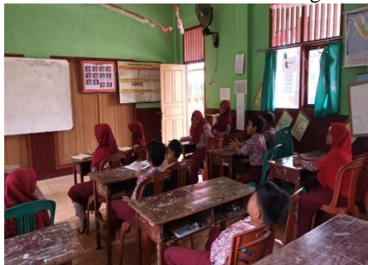
Gambar 4. Sosialisasi Narkotika dan Pergaulan Bebas

Berdasarkan pengamatan, pemberian kuesioner dan analisa mahasiswa terhadap kegiatan sosialisasi bahaya narkotika dan pergaulan bebas, siswa dapat menjelaskan kembali terhadap materi yang telah disampaikan serta menambah wawasan terkaid norma-norma yang dilarang dalam berkehidupan sosial