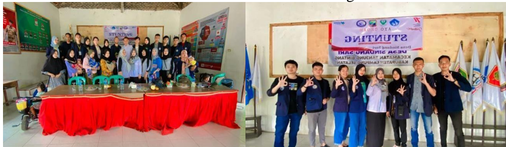
Gambar 6. Sosialisasi Stunting

Berdasarkan pengamatan yang didapat dari desa sindang sari khususnya ibu hamil dan Balita dapat diketahui bahwa pentingnya mengetahui dampang stunting pada anak sejak masih di dalam kandungan dan menjaga pola makan dan kebersihan untuk perkembangan dan pertumbuhan anak.