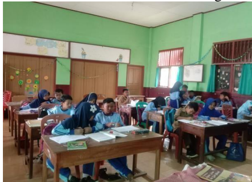
Gambar 5. Sosialisasi Literasi Digital

Berdasarkan pengamatan, pemberian Kuesioner dan analisa mahasiswa terhadap kegiatan sosialisasi, siswa dapat memahami bagaimana bermedia sosial dengan baik dan melindungi privasi individu dalam pelanggaran etis didalam bermedia sosial.