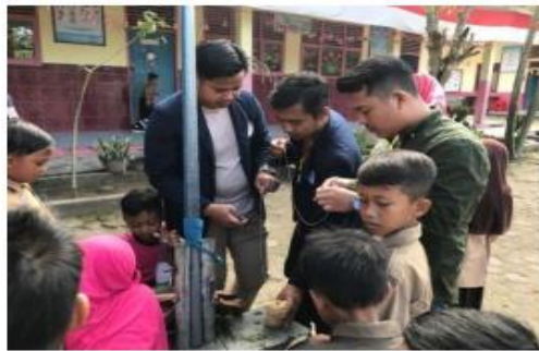
Gambar 10. Perlombaan

Membantu kegiatan lomba di SD Sinar karya yang dilakukan oleh murid kelas 1,2 dan 3.