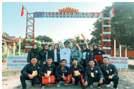
Gambar 11. Upacara HUT NKRI

Mengikuti Upacara serta menjadi petugas Upacara HUT NKRI Yang ke-77