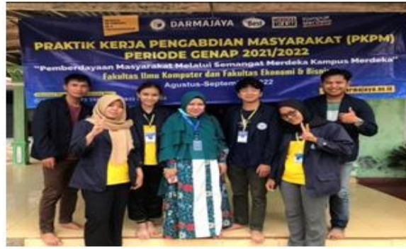
Gambar 9. Kunjungan DPL