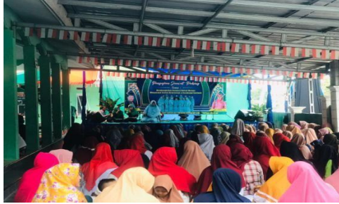
Gambar 12. Pengajian

Mengikuti pengajian jum'at pahing di dusun pendowoharjo