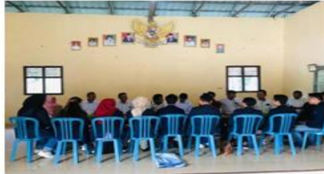
Gambar 5. Silaturahmi Ke Balai Desa

meningkatkan kesejahteraan, kesehatan, dan perkembangan UMKM di Desa Sinar Karya.