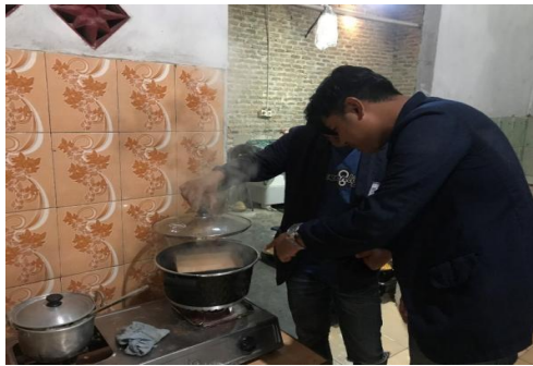
Gambar 13. Proses Pembuatan Kue

Membantu proses pembuatan kue dari awal sampai akhir