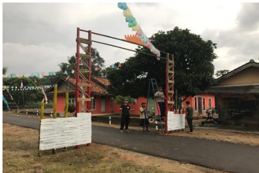
Gambar 8. Gapura

Membantu membuat & mendirikan gapura PKPM Darmajaya atau HUT NKRI yang ke-77.