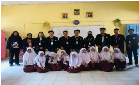
Gambar 6. Observasi SDN Sinar Karya

Observasi dilakukan untuk memperkenalkan mahasiswa PKPM Darmajaya kepada murid-murid dan guru-guru di SDN Sinar karya agar tali silaturahmi kami semakin luas di desa Sinar Karya.