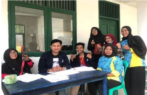
Gambar 7. Posyandu

Pada posyandu tersebut semua balita harus melewati cek berat badan,tinggi badan, hingga suntik imunisasi.