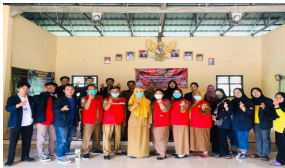
Gambar 14. Vaksinasi Di Balai Desa