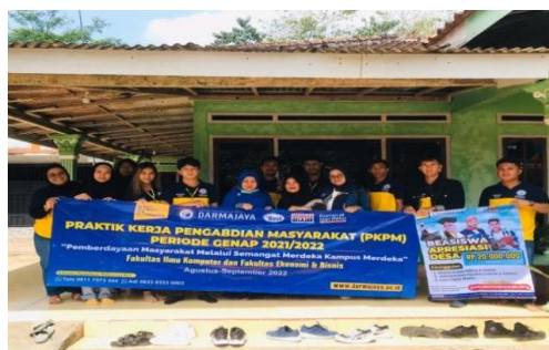
Gambar 4. Pelepasan Peserta PKPM

Pelepasan ini adalah awal kegiatan PKPM yang didampingi langsung oleh Dosen Pembimbing