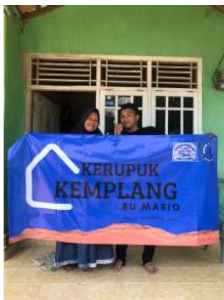
Gambar 2.4 Pemasangan Banner Di Lokasi UMKM.