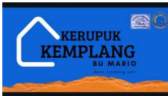
Gambar 2.3 Pemberian Banner Ke Pemilik UMKM.