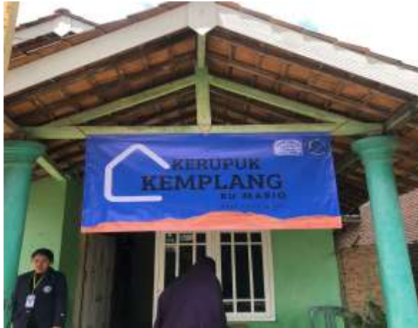
Gambar 2.5 Design Logo UMKM