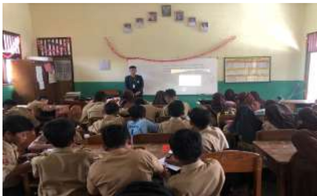
Gambar 2.8.1 Sosialisasi Literasi Digital Di SMP Bhakti Pemuda