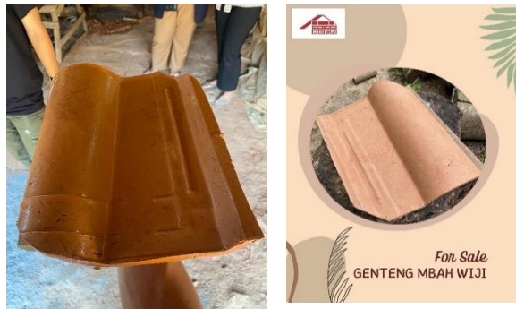
Gambar 2.9 Pengambilan Foto Genteng dan Bata Di Media Sosial

Pemasaran Genteng dan Bata dilakukan dengan beberapa cara yaitu melalui Reseller,delivery dan pemesanan melalui media sosial/E-Commerce.