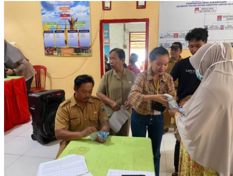
Gambar 2.11 Administrasi Desa

Kegiatan ini dilakukan guna membantu aparatur Desa Suka Negara untuk menginput data BLT Desa Suka Negara.