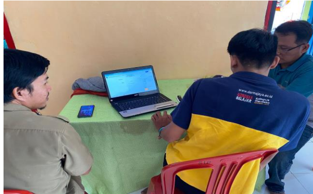
Simulasi Cara Penggunaan