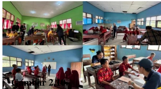
Foto Kegiatan Sosialisasi di SDN 3 Sukamulya